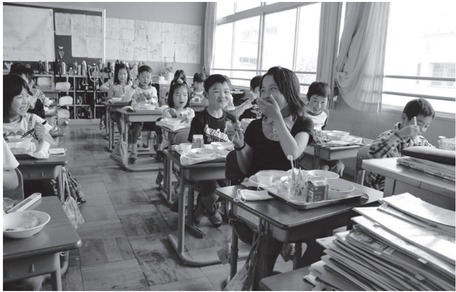
安全でおいしい給食が子どもたちの笑顔の源

市はこのほど、市内の子ども達に安心安全な給食の提供ができるよう、市内3箇所の学校給食センター(水口東部・信楽)に県内で初めて放射線測定器