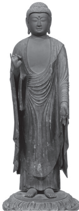
▲①木造阿弥陀如来立像 (金龍院)

① 木造阿弥陀如来立像 (甲南町竜法師・金龍院蔵) 左手を下げ、右手で来迎印を結んだ阿弥陀如来の三尺立像で穏やかな表情をもつ鎌倉時代の作です。