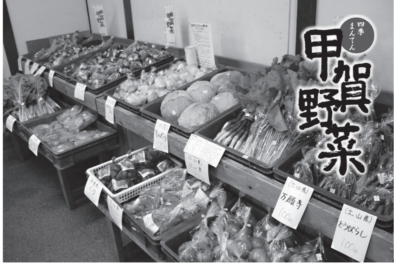
店頭に並ぶ「甲賀野菜」

市内で生産されるコメは、近江米の中でも高い評価を得ています。豊かな自然の恵みに加え、できるだけ農業や化学肥料に頼らない「環境」こだわり米も付加価値をつけて流通しています。一方、杉谷ナスや鮎河菜など、商品化されて広く市場に出回っている特産野菜もあります。市では、農業全体を振興させるためには、水稲だけでなく野菜づくりも重要と考え、「甲賀野菜」の普及に取り組んでいます。地場でとれる新鮮野菜を生産者と消費者によってブランドへ育てていくことをめざしています。