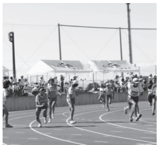
▲新しい競技場で白熱する各小学校対抗リレー