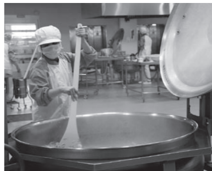
この釜で一気に1,000食分を

直径70センチはあ る大きなザルに入っ たじゃがいもは、あ っという間に短冊 切りになり、調味料 も計量済みで、ポ ールに分けられてい ました。また、一度 に1,000食分が作れ るといふ大きな蒸 気釜には、ひじき・ 油揚げ・人参・さつ ま揚げなどの材料が 入れられ、船を漕ぐ オーロルのようにな しやもじでかき混ぜ られて仕上げられま す。ガラスを隔てた 見学の窓から見ても 美味い匂いが漂って きました。