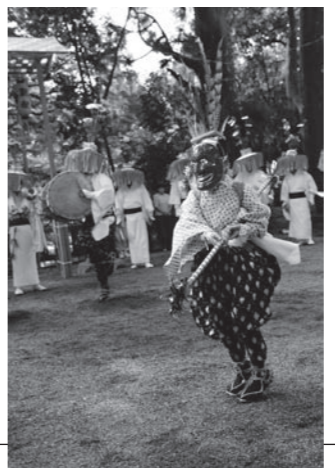
▲独特の面をつけて舞う山女原太鼓踊り▲