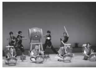
▲勇壮な和太鼓六友会のステージ