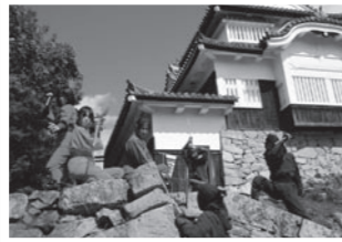
▲本格的な忍者ショー