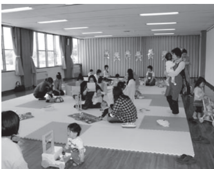
▲子育て支援を行います

○環境パトロール 不法投棄監視員と部会が協力し「美しい伴谷」をめざしています。地味な活動ですが継続した取り組みが大切。今年は小学生の標語コンクールを実施し啓発看板を作成しました。