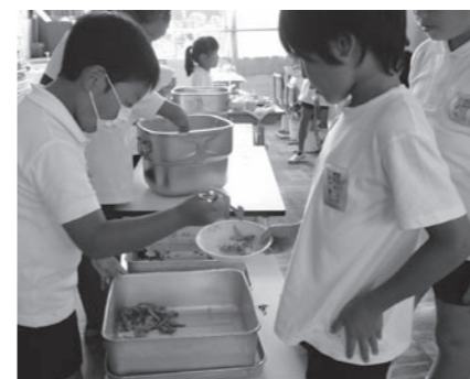
全部きれいに食べちゃいます

私が思わず、「子ども 達が食べている大き なザルに入ったじゃ がいもは、あっとい う間に短冊切りに なり、調味料も計 量済みで、ポール に分けられていま した。また、一度 に1,000食分が 作れるという大き な蒸気釜には、ひ じき・油揚げ・人 参・さつま揚げな どの材料が入られ られ、船を漕ぐオ ーロルのようにな しやもじでかき混 ぜられて仕上げら れます。ガラスを 隔てた見学の窓 から見ても美味い 匂いが漂っていま した。