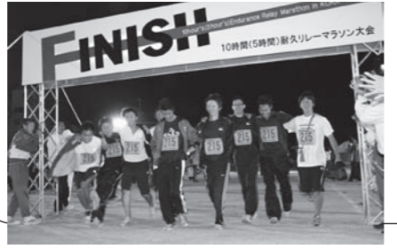
▲チーム全員でゴール

やっと迎えたゴールでは、参加者が最後までがんばった充実感に、チームの壁を超え、肩を抱き合って健闘をたたえ合いました。