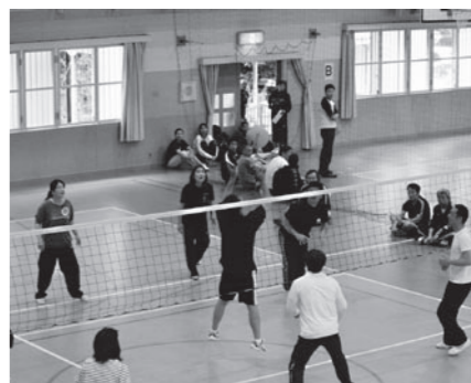
▲盛り上がるソフトバレー

○ソフトバレーボール大会 各区内でチームを編成し熱戦を展開。年々技術も向上し盛り上がりを見せています。