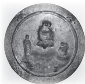
▲銅造摩利支天像三尊像懸仏 元禄3年(1690) 油日神社蔵