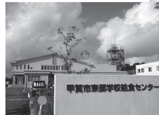
甲賀市東部学校給食センター