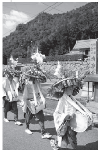
▲青土の集落を練り歩く踊り子の列

この日山女原では、数年ぶりに行われた太鼓踊りが文化庁の事業により撮影が行われ、祭りの主役である地域の子どもたちも古式にのっとった伝統を練習どおり披露していました。