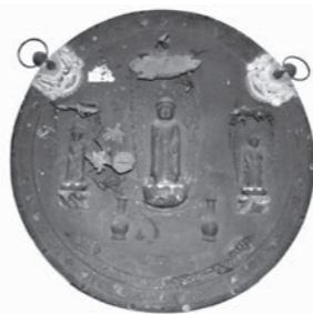
▶県内で最大級の懸仏 銅造釈迦三尊像懸仏 油日神社蔵