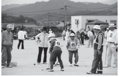
▲和やかな中にも真剣な試合風景