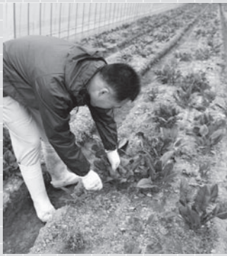
朝採れたホウレンソウを新鮮なうちに

自分の野菜を売ることがもちろんですが、それだけでなく「甲賀野菜」といえば、安全で、味も間違いないと誰もが知っている、そんなブランドに育ってほしいという願いを込めて、私も誇りを持って野菜を作っています。