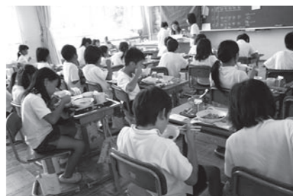
毎日楽しみな給食の時間

旧町時代に甲賀学校給食センターとして親しまれていた建物も老朽化が進んでいたため、甲賀市誕生を機に甲賀・甲南・土山の三町の子どもの食数(約四千八百食)を賅う設備を整えた立派な施設になりました。新しくなって早7年を迎える東部給食センターは、清潔感にあふれ、ゆとりある搬入搬出口が印象的でした。