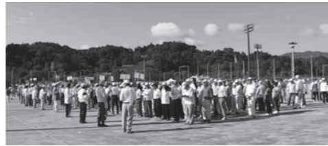
▲多くの参加者で賑わったかんぴょうの里杯

第16回水口かんぴょうの里杯親善ゲートボール大会が10月2日、スポーツの森で、第10回忍者の里杯親善ゲートボール大会が10月10日、甲南グラウンドでそれぞれ開催されました。両大会とも毎年、県内外から多くの参加者で賑わいます。忍者の里杯大会では今大会、伊賀市、亀山市のチームが揃って顔を合わせました。県境を越えた隣のまちと交流を深められたことは意義深いと関係者は話していました。