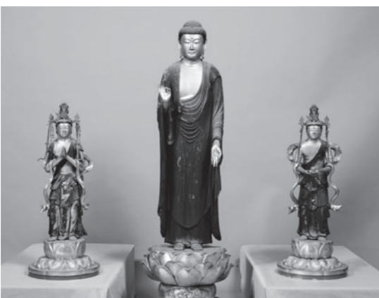
▲木造阿弥陀如来及両脇侍立像 (左:勢至菩薩立像 中尊:阿弥陀如来立像 右:観音菩薩立像)

市内でこういった銘文が入った仏像が見つかるのはまれで、日本史に名を残す人物の名が記された上、お像が造られた目的、造像の年代や作者が判明するなど、甲賀市の歴史を知る上で重要な発見となりました。