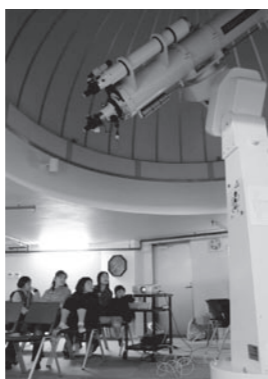
▲体験コーナー(天体観望会)