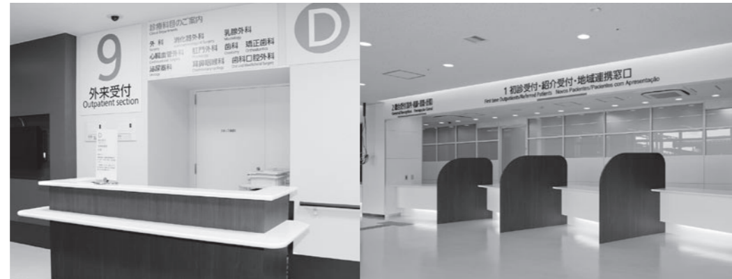
▲予約再来受付などを行うブロック受付は4カ所設置されている