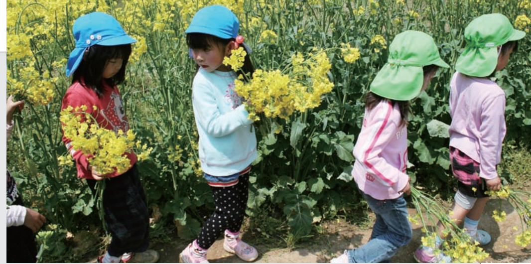
▲菜の花やひまわりを田んぼに植えて地域に開放する取り組みや市民農園開放等による高齢者の生きがいづくりを行うNPO法人「鹿深の杜」