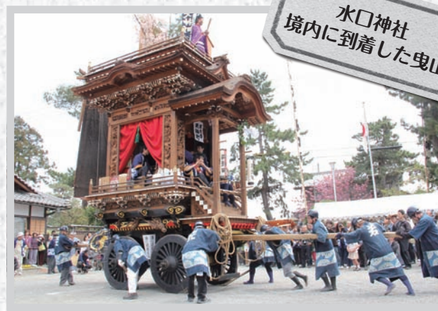
水口神社境内に到着した曳山

「水口曳山祭」が4月19・20日の両日、水口町旧市街一帯で行われ、多くの人出で賑わいました。 江戸中期に起源を持ち、県無形民俗文化財に指定されている同祭礼は、市内唯一の曳山祭で、今年も16基ある曳山のうち4基が水口神社に奉納されました。 曳山と地域の引手一行は20日早朝、各地の山蔵を出発し、観客で埋まった神社までの道中をゆつくりと巡行しました。到着した神社境内では、テンポの良いお囃子に乗せて勇壮な「宮入り」を披露し、詰めかけた観客から大きな歓声が上がっていました。