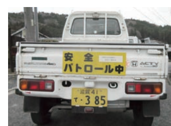
▲両区が取り組む地域の見守り活動

―地域の安心・安全のための取り組み― 地域の安心・安全のため、両区の役員が地域の見守り隊を発足しました。