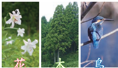
花 ササユリ 木 スギ 鳥 カワセミ