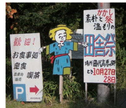
▲市内外から見物客が訪れる「案山子まつり」

●力作が並ぶ案山子まつり―田代区― 毎年10月には、田代区を挙げて田代高原の郷を会場に案山子まつりを行っています。 展示される案山子は、区民が工夫をこらして何か月も前から製作しており、各戸自慢のものばかり20体以上並びます。ほかにも地元の特産物の販売や模擬店もあり、市内外から大勢の見物客でにぎわいます。 同時に文化祭や、青少年育成区民会議が実施する子ども写生会を行いました。写生会では、多くの子どもさんが参加し、案山子のある風景を描いた力作が揃いました。