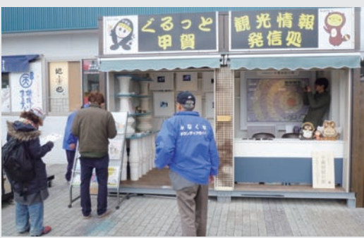
▲リニューアルされた「くるっと甲賀観光情報発信処」

新名神高速道路の土山サービスイリアで甲賀市の観光情報を提供しているアンテナショップが4月からリニューアルオープンしています。