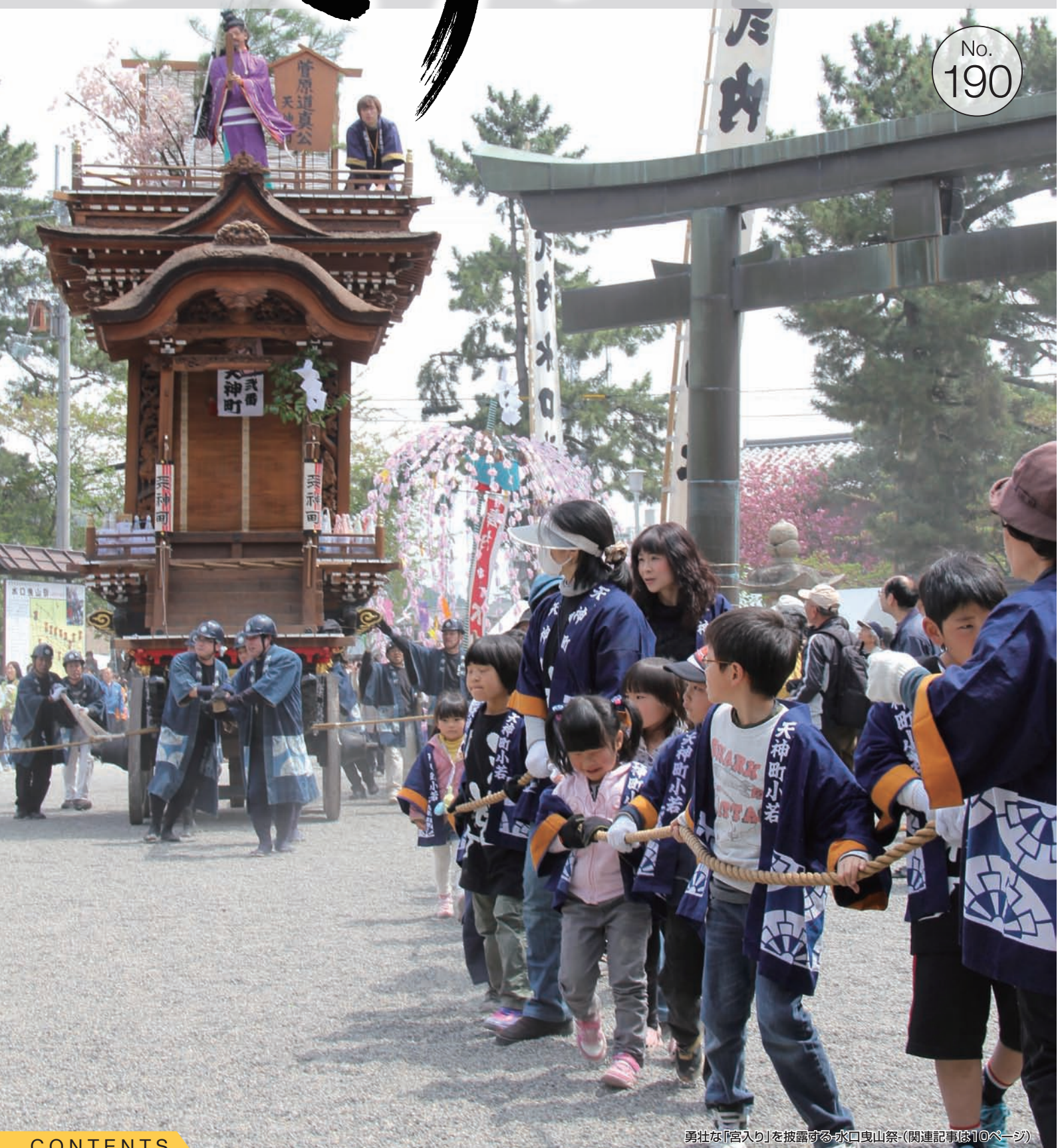
勇壮な「宮入り」を披露する水口曳山祭(関連記事は10ページ)