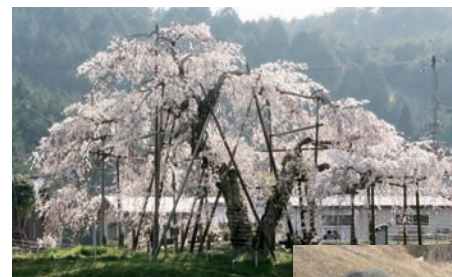
▲樹齢400年といわれる畑のしだれ桜

畑区には、樹齢が400年とも言われるしだれ桜があり、市の天然記念物に指定されています。毎年、4月の中旬には県内外より大勢の見物客が訪れます。 畑区では、この桜を長く残そうと、区民が協力して保存に取り組んでいます。今年も、3月に保存事業として、支柱の取り換えを行いました。 ※畑シダレザクラ保存会が公益財団法人日本さくら会の会からさくら功労者として表彰されました。関連記事は6ページ