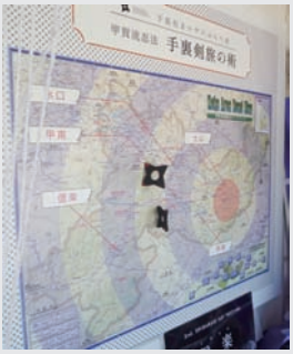
▲手裏剣投げコーナー

また、「忍者」「信楽」「東海道」という観光三要素をPRするため、アンテナショップのシャッターには隠し絵が施されています。皆さんもぜひ一度お立ち寄りください。