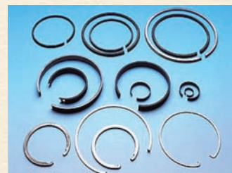
▲製品の一例(止め輪)

現在、中国に事業所を構えており、今後生産活動が本格化してくる中で、支援の強化と次期の海外進出を見据えた情報収