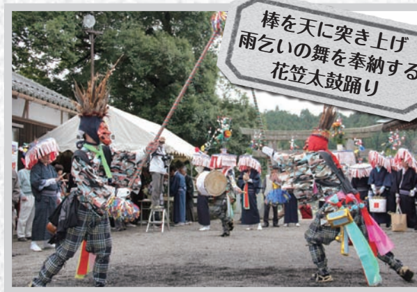
棒を天に突き上げ雨乞いの舞を奉納する花笠太鼓踊り

県無形民俗文化財に指定されている土山町黒川の「花笠太鼓踊り」が4月21日行われ、約200名の観客が訪れました。 黒川を構成する四つの地域から踊り子一行が出発し、道中で他の一行と「出会い」、大宮神社境内で雨乞いの踊りを奉納します。 踊り子は、ほら貝と太鼓で奏でられる独特な拍子にあわせて、2mもある棒を振り回す、伝統の踊りを披露しました。この日、ほら貝を吹いた男性は「準備などは大変だが、地域の伝統を守っていきなさい」と、長く続く地域の営みを自らも受け継ぐことに誇らしく語っていました。