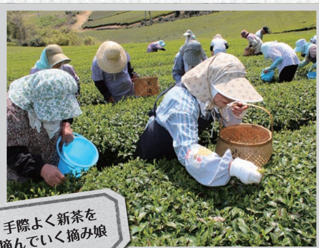
手際よく新茶を摘んでいく摘み娘

今年も市内各地で新茶の収穫が始まりました。 作業のトップをきって、農業組合法人「グリーンティ土山」が管理している水口町の集団茶園内で4月25日、県内で今年初となる新茶の手摘みが行われました。 土山地域の方約30名が、手際よく新茶を摘み、12アールの面積から生葉約200キログラムを収穫しました。 収穫された茶葉は、この日のうちに製茶され翌々日には小売店に並びます。 今回の茶の生育について、同組合の代表は、「4月の寒さをネットで覆い防いだため順調に生育しており、良いものができる」と期待しています。