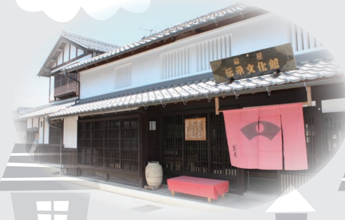
▲扇屋伝承文化館は、地元自治会が築140年の扇屋跡を購入改築したもので、地域文化の紹介や観光情報の発信、特産品販売などを行っている

この講座なども予定しており、継続して実施していきます。 多くの皆さんの参加で住みよいまちへ まちづくりは、一人ひとりの参加者がそれぞれの能力や得意技を発揮し、力を合わせることで、より活気あるものになります。 自分の得意分野を生かして、できる範囲で楽しみながら取り組む活動が、人に喜ばれたり、地域を活性化することにつながります。 地域のことをもっと知りたい、地域のために自分の力を生かしたいなど、地域やまちづくりについて興味のある方はお気軽にご参加ください。