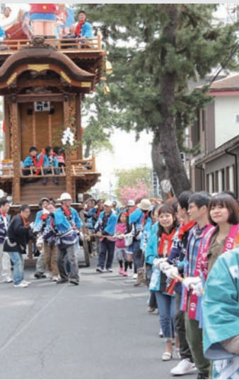
▲水口曳山まつりで3名の新任観光サポーターが曳山に挑戦