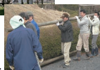
地域で取り組む保存事業▶