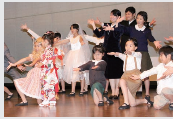
▲市民参加を募り、歴史文化遺産を題材に毎年創作ミュージカルを上演するNPO法人「甲賀文化輝き」

「まちじゅく」って? この講座は、市民の皆さんがまちづくりに関心を持ち、地域活動に取り組みきっかけとなるよう開催するもので、市内に在住、在学、在勤する方なら誰でも参加できる学びの場です。 講座では、市内で活躍されているたくさんの団体の取り組みや、やりがいを持って活動している方々との交流を通してまちづくりについて学びます。 6月からは、「甲賀まちづくりサロン」・「ゆるゆる甲賀発見講座」の2つが開催されます。今後は、まちづくりの実践的な手法について学びます。