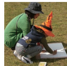
▲「案山子まつり」での子ども写生大会