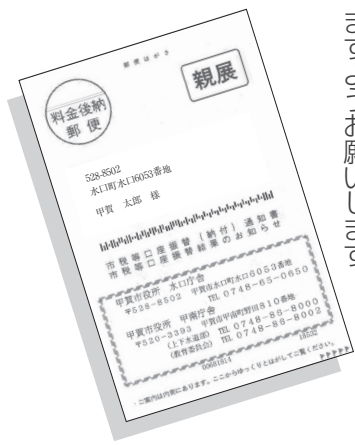
▲廃止される「市税等口座振替通知書・振替結果のお知らせ」の圧着ハガキ

上下水道以外の税料金については、納税通知書や料金のお知らせを保管して、口座残高の管理をしていただきますようお願いいたします。