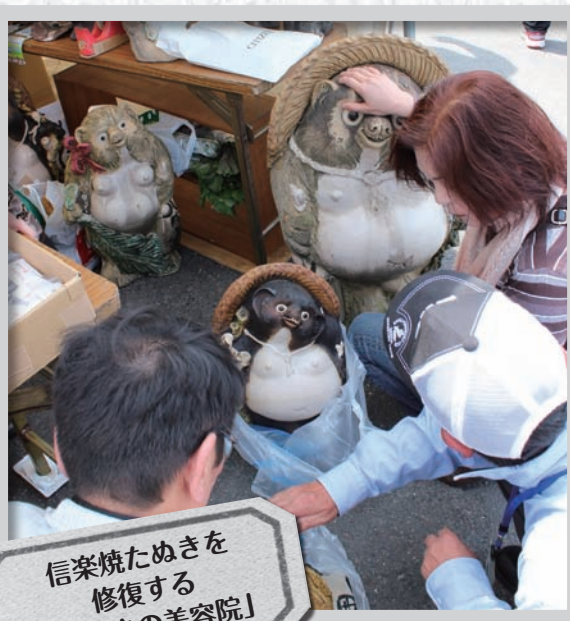
信楽焼たぬきを修復する「たぬきの美容院」

毎年恒例のしがらき駅前陶器市が4月27日から5月6日にかけて、信楽駅前広場で開催され、県内外から多くの来場者でにぎわいました。 信楽焼のブースやうまいもの市が並び会場では、日替わりオークションなどのイベントも行われ、お値打ちの一品を手に入れようと次々と声があがりました。 また、今回初めて信楽焼たぬきの修復を受け付ける「たぬきの美容院」やたぬきを買い取る「たぬきの里帰り」が設置されました。 30年前に買ったたぬきを美容院に持ち込んだ大阪の夫婦は、「愛着があるので、直してもらって飾っておきたい」と話していました。