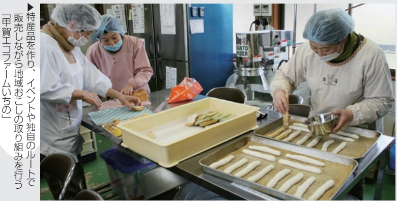
▶特産品を作り、イベントや独自のルートで販売しながら地域おこしの取り組みを行う「甲賀エコファームいちの」

□定員:先着30名 ※最初に全7回の受講申込を受付。7回すべて参加することが望ましいですが、都合により全て参加できない場合も受講は可能です。 □申込方法:所定の申込書を申込先まで提出してください。(地域コミュニティ推進室に申込書が届いた時点で受付となります。) □申込締切:6月14日(金) □受講料:3,000円(7回分)※欠席された場合も返金できませんのであらかじめご了承ください。