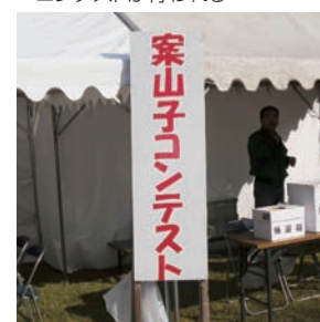
▼来場者による投票でのコンテストが行われる