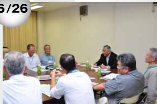
▲和やかな雰囲気で見聞交換