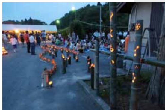
▲雲井駅を幻想的な雰囲気でお包む「竹灯ろう」