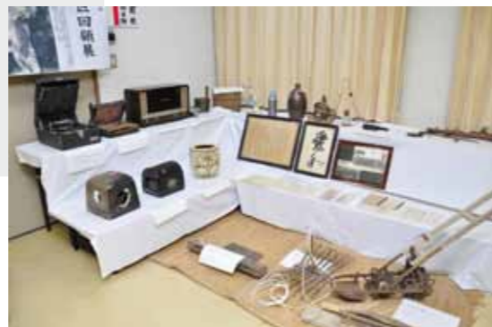
▲保存活動により集められた「宮のお宝」