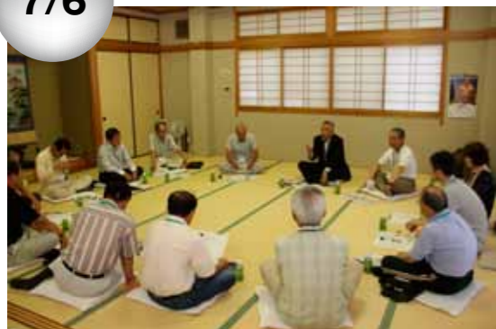
▲車座で地域の皆さんと