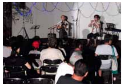
▲ギターやヨシ笛の音色を楽しむ「夕涼みコンサート」

8月4日19時から、多羅尾小学校中庭で2回目となる夕涼みコンサートが開催され、区民の皆さんのほかに市内からたくさんの方々が参加がありました。