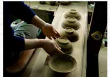
▲伝えたい思いをカタチに込めて

説パネルも統一性を保ちつつ、出展者個々の意図が伝わるものになるように、と話し合いを重ねています。