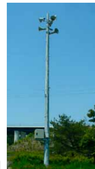
市内219カ所に設置されている屋外スピーカー