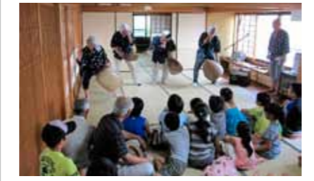
▲どじょうすくいが披露される会場

新城區近所福祉会主催の納涼ふれあいサロンが7月21日、新城草の根集会所で開催され、約80名の区民の皆さんが参加しました。