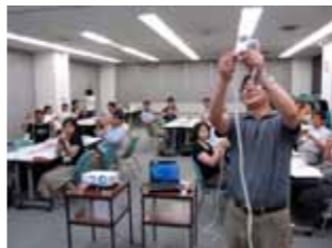
▲ロープワークを学ぶ