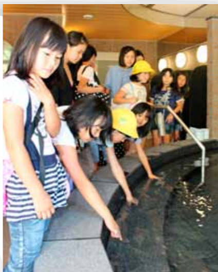
▲真新しい温泉の湯加減を見る児童

土山町大河原の旧国民宿舎「かもしか荘」が建て替えられ、「大河原温泉かもしか荘」としてオープン。前日に控えた7月19日、鮎河小学校の児童23名が同施設を訪れ、一足先に温泉を楽しみました。 この見学会は、地元の施設に親しみを持ってもらおうと同小学校のPTAが中心となり、施設の運営者に呼びかけて実現したものです。 児童は、一新された外観や真新しい客室などを見て回り、畳の匂いや窓からの眺めに感激していました。 最後にみんなで温泉を満喫し、「また家族と絶対来たい」と話していました。