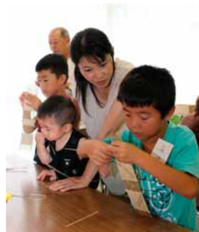
▲慎重につるを編む参加者

甲賀伝統文化活性化実行委員会が主催する水口細工体験教室が7月23日、あいこつか市民ホールで行われました。 水口細工復興研究会の皆さんが講師を務め、市内の小学生35名が藤つる編みで壁掛け花入れ作りに挑戦しました。 水口細工は、植物の繊維を使った細工物で、江戸時代、水口宿のお土産として有名でした。約50年前に途絶え、同研究会が10年以上かけて当時の製法を復興しました。 子どもたちは、つるが切れないように水にぬらしながら慎重に編み進め、自然の素材で丁寧に作られる細工物の魅力を実感していました。 ■企画展「世界が賞賛した水口細工」期間/10月2日(水)まで 場所/水口歴史民俗資料館