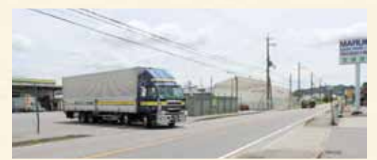
▲国道1号線に面する当社の物流拠点

運送業では、新名神高速道路の甲賀・土山インター開設にともない、物流拠点の整備拡充や輸送体制の確立を進めていると