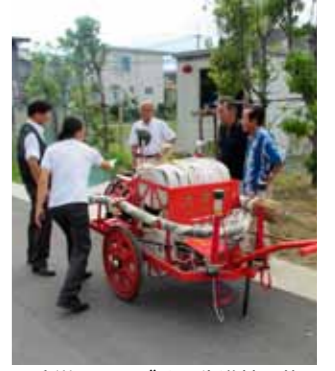
▲防災のまちづくり先進地研修

万が一の災害に強いまちを目指し、自主防災組織の先進的な取り組み状況の視察研修や防災訓練として消火器や消火栓の使い方、初期消火訓練、非常食を配布する給食給水訓練と併