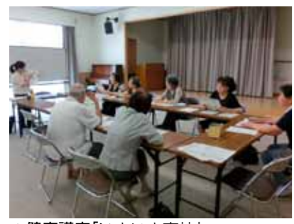
▲健康講座「いきいき南仙」

この講座は、毎月テーマを変えて計7回実施する予定です。受講を希望される方は当センターまでご連絡ください。(☎086-81990)