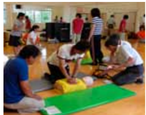
▲心肺蘇生法を学ぶ

今年度も5回の開催の中で、緊急時に対処するための心肺蘇生法や水上安全のための着衣泳法等を学びました。