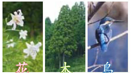
花 ササユリ 木 スギ 鳥 カワセミ