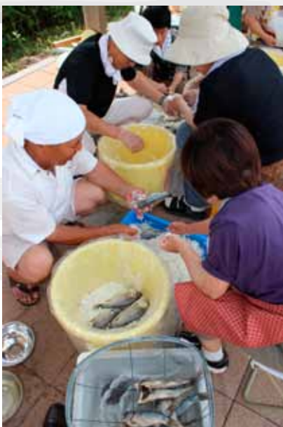
▲出来栄を楽しみにフナを漬けて楽しむ参加者

フナズシの漬け方講習会が7月30日、くすり学習館で開かれ、参加者30名が、一日かけてフナの「飯漬け」を行いました。 この講習会は、甲賀市フナズシ愛好会が初心者を対象に毎年開催しているもので、今年で3回目です。 滋賀県水産試験場から2名が講師として漬け方を伝授。一人につき約20尾の塩切りフナを一尾ずつ水洗いし、干したものを桶の中にご飯と交互に敷き詰めました。 参加者は、米の品種や塩加減、フナの飯の詰め方などそれぞれこだわって漬けていました。 昨年参加された方は「自分で漬けたフナズシは、クセが無く上品な味」と、食べごころになるお正月を心待ちにしていました。