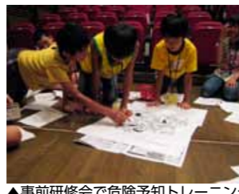
▲事前研修会で危険予知トレーニング

また、指導する青年リーダーには、子どもたちのかかわりの中から、これまでの研修や体験を再確認し、指導者としての基礎を学ぶ機会としています。