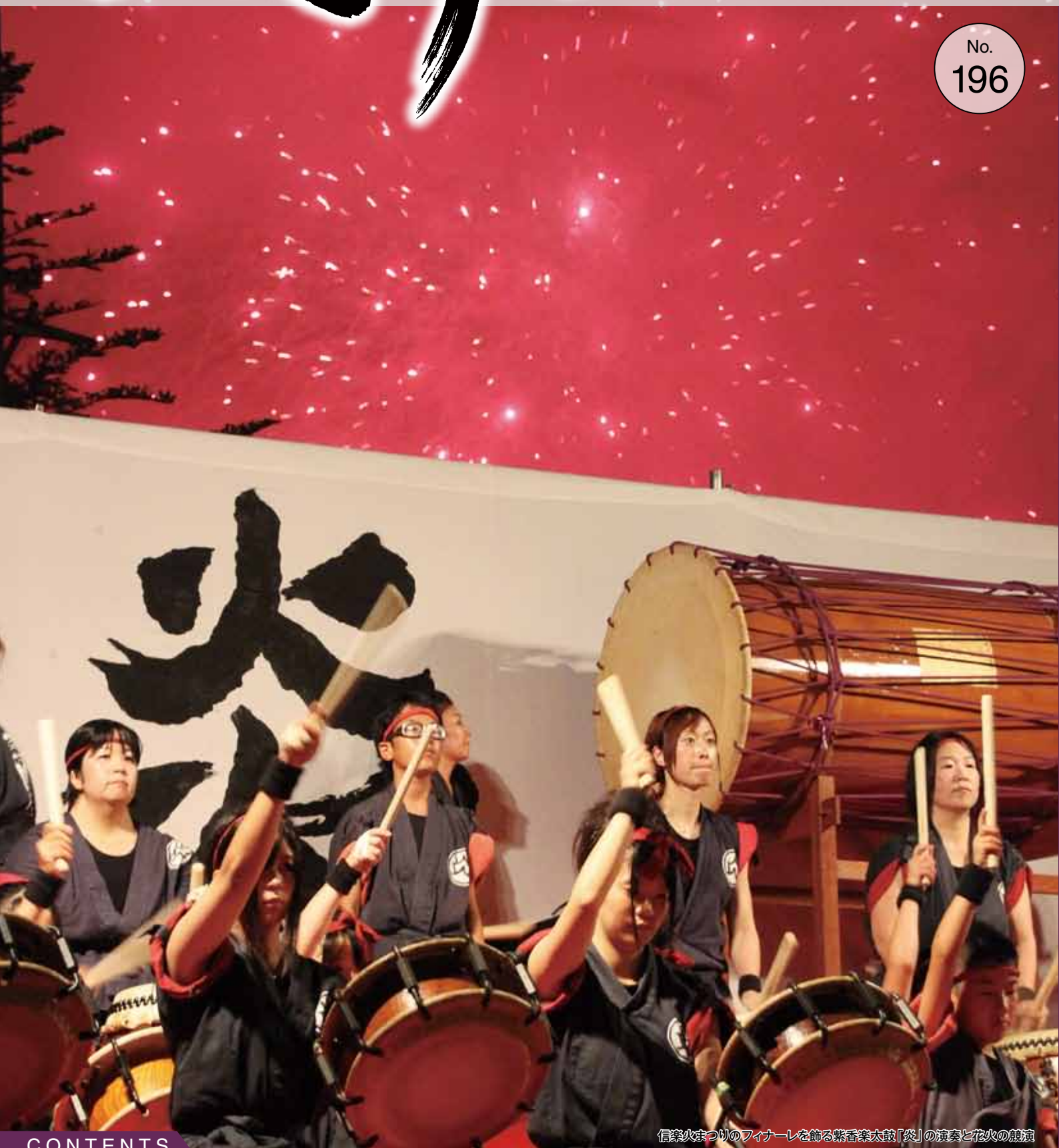
信楽まつりのファイナーレを飾る紫香楽太鼓「炎」の演奏と花火の競演