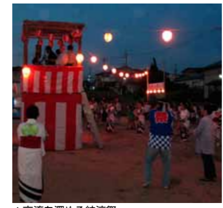
▲交流を深める納涼祭

①絆が深まるまちを目指して 地域には他所から引っ越して来られた方が多く住んでおられます。その方々に本町地域を故郷として感じてもらうこと、そして地域全体の絆を深めることを目的に、本町自治会と共催し、夏に納涼祭を開催しています。納涼祭は、小さな子どもさんからお年寄りの皆さんまで多くの方に参加していただき、地域の皆さんが交流できる場となっています。