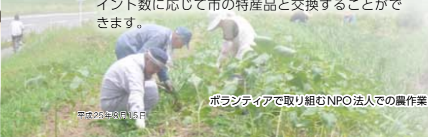
ボランティアで取り組むNPO法人での農作業