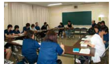
▲11月のイベント開催に向けて

年齢性別を問わず、1人対1人の個人戦から6人対6人の団体戦までできます。ハンデなしで幅広い方に気軽に楽しんでいただけます。