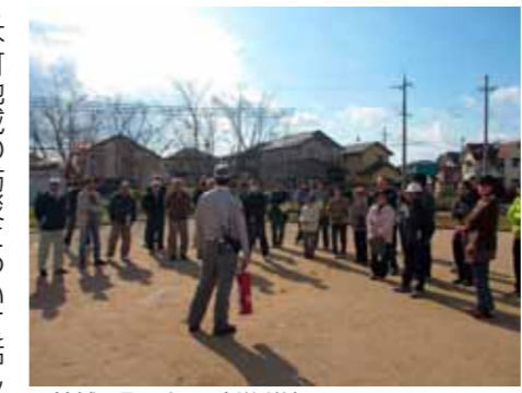
▲地域で取り組む防災訓練

せて本町地域の防災について話し合いを行いました。そして、研修で学んだことや防災訓練での話し合いを参考にしながら、地域として今後の防災についての取り組みを検討するとともに防災備蓄品の整備を順次