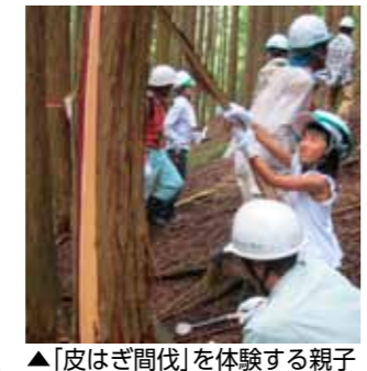
▲「皮はぎ間伐」を体験する親子

この集いは、水を使う下流のまちと、水の源である上流のまちとの交流を目的に、甲賀愛林クラブが2004年から行っているもので、今年で10年目を迎えました。