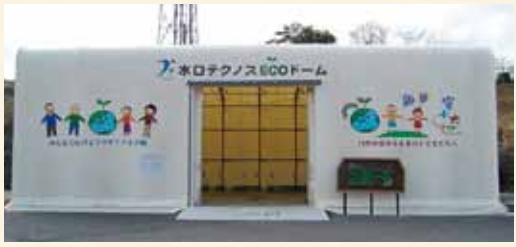
▲いつでも資源ごみを持ち込める「エコドーム」

住所/水口町伴中山 236-1 開場日時/年中無休(年末年始除く) 朝9時～夕方5時 持込可/古着・空き缶・ペットボトル・びんなど市指定の資源ごみ 持込不可/燃えるごみ・生ごみ ※無料でいつでも引き取ります 問い合わせ/☎65-0123