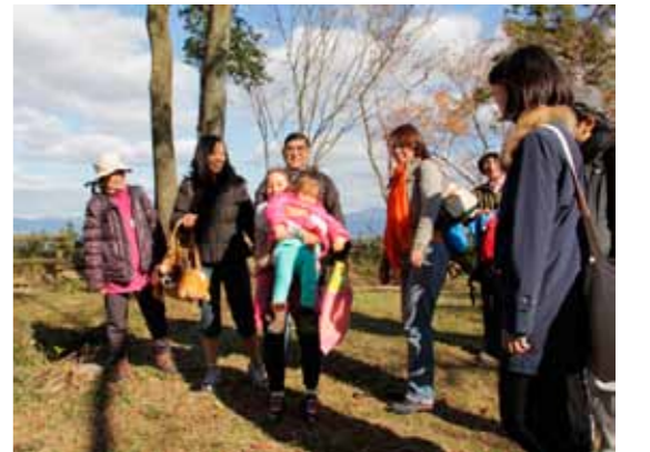
▲山頂の澄んだ空気を満喫

国際交流グループ「鹿深でござれ〜」が主催する「おやまdeコミュニケーション」が11月23日、ブラジルや中国籍などの住民ら約10名が参加して開催されました。 この催しは、水口古城山で在住外国人の皆さんと一緒にハイキングを楽しみ、お互いの持つ文化的背景を尊重して交流できる場を作ることが目的です。 一行は、赤や黄に彩られた秋の古城山で頂上までハイキングし、おにぎりや唐揚げの詰まったお弁当をみんなでお楽しみました。 中国から来日中の参加者は「実は山登りは生まれて初めて体験しました。自然を大事にする文化が素敵ですね」と、興味深い様子で話してくれました。