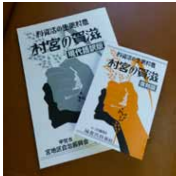
▲「滋賀の宮村」復刻版と現代語訳版

宮地区自治振興会は、「滋賀の宮村」に学ぶ事業の一環として、昭和7年に刊行された「滋賀の宮村」を復刻出版しました。「滋賀の宮村」は、昭和初頭の恐慌による農村不況の中、全国の経済更生運動の先駆けとなった郷土「宮村」の歴史を今に伝える貴重なものです。先人たちの偉業を後世に伝えるとともに、将来に向けたまちづくりの生かし、地域に活力を取り戻したいとの思いから出版されました。現代語訳版も併せて作成し、2冊をセットで全戸に配布。11月30日には「復刻版出版記念講演会」が開催されました。セット1500円で販売中です。