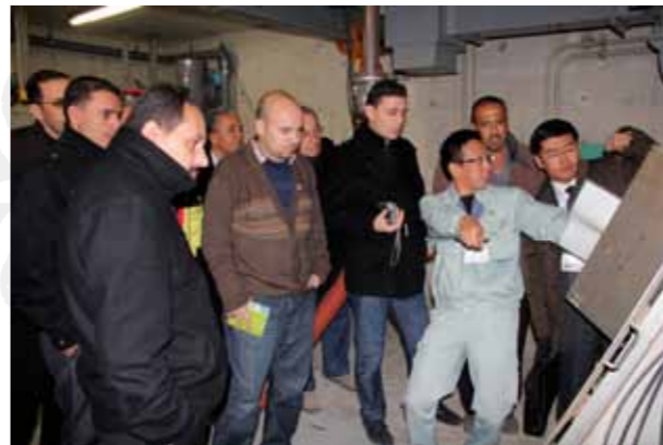
▲熱心に説明を聞く視察団

中東パレスチナの都市ジェリコ市の視察団11名が11月20日、日本の援助で同市に公営汚水処理施設を建設するJICA実施のプロジェクトの一環として、土山町オー・デュー・プールの汚水処理技術を視察しました。 ジェリコ市は、旧約聖書などにも登場する歴史深い街でヨルダン川西岸地区にありますが、この地域は、海抜が低く水が流れにくいいため、汚水が環境に悪影響を及ぼしています。 技術者と政府や市の職員が、建設中の先進施設を自分たちで管理・運営するための基礎知識を学び、この問題の解決にあたります。 視察団の一人は、下水道課職員の解説に「国の未来のため」と学ばねば」と熱心に質問し、メモをとっていました。