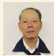
お話を伺った森井工場長

DATA 設立/平成9年 従業員数/127名 所在地/水口町新城525番地 ☎62-0841 ☎62-9600