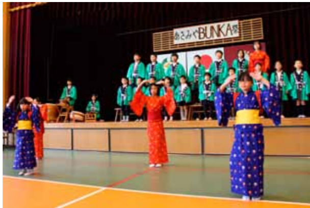
▲朝宮茶摘み唄などの合唱を披露する朝宮小学校児童

朝宮茶まつりと朝宮学区文化祭が11月23日、朝宮小学校で開催され、多くの来場者で賑わいました。 茶まつりは、香り高い朝宮茶を広く知ってもらおうと信楽町茶業協会が20年ほど前から開催しているもので、手もみ茶体験やお茶当てクイズなどが催されました。 産地で朝宮茶を味わえる機会に、生産者は、「急須で淹れたお茶の美味しさを見直してほしい」と話し、参加者は、味わいの違いを実感していました。 また、文化祭では朝宮小学校児童による朝宮茶摘み唄などの合唱が披露され、お茶の文化に親しむ一日となりました。