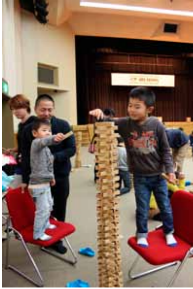
▲慎重に「カプラ」を積み上げる親子

水口町保育園保護者連絡協議会が行う保護者研修が12月1日、碧水ホールで開かれ、水口町内の保育園に通う園児と保護者340名が単一の形をした積み木「カプラ」を楽しみました。 この催しは、保護者の親睦と交流を図ろうと同会が毎年開催しているものです。 会場には約3万枚のカプラが用意され、親子は、どこまで高く積み上げられるか挑戦したり、かまぐらや列車など思い思いの形を作り出したりして夢中になって取り組みました。 ステージ上には、約2千枚を使った立体ドミノ「ナイアガラの滝」が作られ、心地よい音を立て美しく崩れると、会場からは拍手が沸き起こりました。