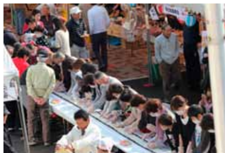
▲80mの長巻き寿司に挑戦する参加者

11月4日、伴谷地区文化祭の会場では、マスクに手袋姿の長い人の列ができました。文化祭の恒例行事となった長巻き寿司に集まった人は総勢250人。平成23年には60m、平成24年には70mと記録を伸ばし、今年は80mを目標に企画。準備された整理券もあつという間になくなり、進行役の掛け声にみんなの気持ちを合わせ、途中で切れてしまわないよう30分をかけ完成しました。長さに劣らぬおいしい巻き寿司を手に、秋晴れの文化祭を堪能されてきました。