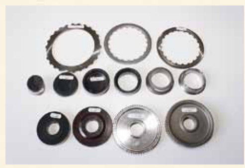
▲製品の一例（ベアリング部品）

滋賀工場では、冷間鍛造工程を中心に高精度な製品生産を行っているほか、熱間鍛造と冷間鍛造を併設しており、複合加工を行うことで製品精度の向上とともに大幅なコストダウン、納期短縮を実現しているなど他社にはない強みがあります。