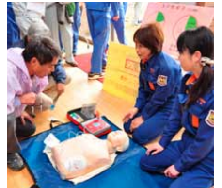
【展示・啓発コーナー】

会場内では防災関係機関などによるパネル展示や甲賀市消防団女性消防隊によるAED使用方法の実演なども