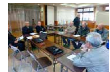
▲昔の記憶を呼び起こして

人生を一本一本の糸で織られた織物に例えましょう。その糸は今までに経験した喜び、楽しみ、苦しみ、辛さを含んだ記憶です。この糸で作られた織物は人それぞれでさまざまな色や形があるでしょう。そしてその全てに価値があるものです。山内回想遺産グループと山内自治振興会では、戦中戦後を生き抜いてこられた人生の先輩方の様々な体験や大切な結いの精神を、後世に引き継ぐこと、記憶を呼び起こすことによる頭の体操(介護予防)を目的に「山内回想遺産づくり教室」を実施しています。教室には様々な体験をしてこられた方が集まり、昔の山内の様子や遊びについて語り合ったり、子ども達の頃に食べたおやつ再現、そしてたいへん貴重な資料の収集もおこなう事が出来ました。