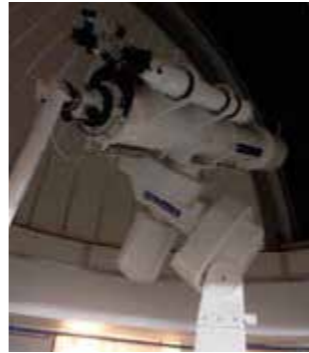
▲関西屈指の大きさです