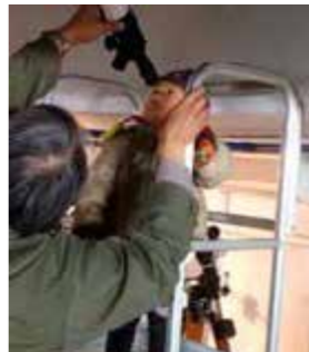
▲子どもさんも参加