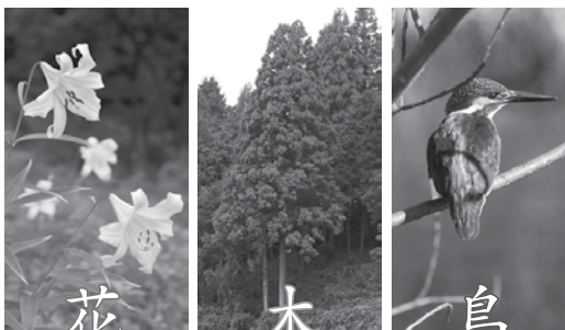
花 ササユリ 木 スギ 鳥 カワセミ

編集後記 素数のところどころにしか目盛が記されていない「素数竹ものさし」が甲賀市商工会から寄贈されました。京都大学の不利益システム研究所とサマーデザインスクールの共同監修で同商工会の会員企業が製造し、供給が間に合わないほどの人気ぶりだそうです。 「24以下の自然数は全て『素数ものさし』のどこかに隠れている」というように、素数の目盛を足したり引いたりして測ります。考える楽しさを得られる「不ばさ」も大切にしたいものです。