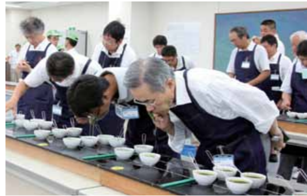
▲27人の専門家による審査風景