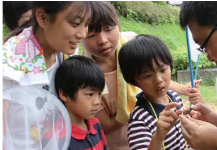
▲セミの発音器官をみんなで観察

くすり学習館で8月2日、夏休み期間中の児童を対象にした昆虫観察会が開かれました。 この日は、甲南高校の生徒7人がサポートスタッフとして参加し、児童と一緒になって近くの草むらや雑木林に分け入り、虫捕り網を使ってセミ、バッタ、蝶、カマキリなどの昆虫を採取しました。 捕まえたセミを観察し、発音器官のしくみについて説明を受けた児童らは、小刻みに震えるセミの腹を興味深そうに覗き込んでいました。