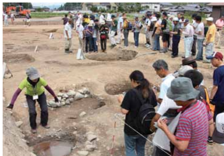
▲説明を聞きながら遺跡を巡る見学者

平成25年9月から発掘調査が進められてきた貴生川遺跡で戦国時代の城館跡が発見され、8月3日に現地説明会が開催されました。 この城館跡は、約50m四方に及ぶ規模や、良好な遺存状態、これまで平地での城館の存在が確認されていなかった場所での発見であったことなどから、戦国時代の甲賀武士団の歴史や城郭史における重要な発見とされています。 見学者らは係員の説明を受け、緊張した乱世の雰囲気を感じながら遺跡を巡りました。