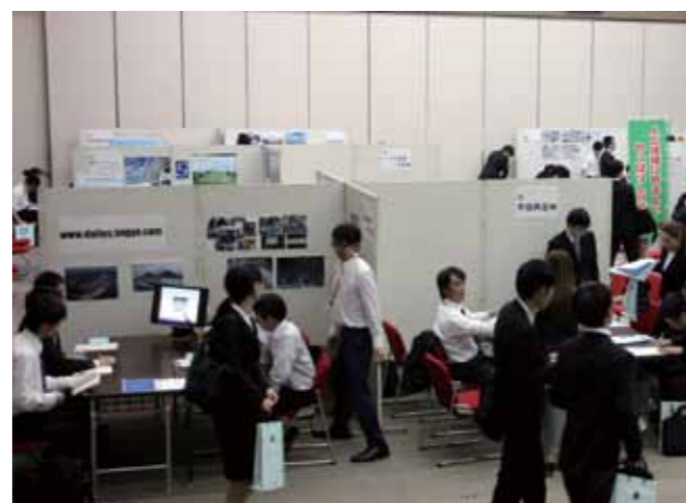
▲企業ブースを巡る就職希望者

営業、事務、介護、建築土木、製造など、幅広い職種で採用を予定する31の企業ブースが設けられた会場では、採用担当者から各企業・事業所のPRや採用に関する説明が行われ、就職希望者はメモを取ったり資料を確認しながら、熱心に聞き入っていました。