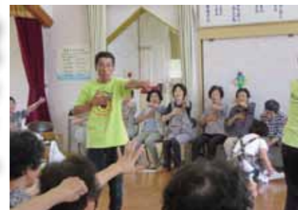
▲みんな元気に「ハ・ハ・ハ」

鮎河学区の75歳以上の高齢者の方を対象に「ふれあいサロン」が7月20日、休園中の鮎河保育園で開催されました。前日から、暑い中ボランティアの皆さんがきれいに掃除してくださった園舎に集まった参加者たちは、早速「笑いヨガ」にチャレンジ。ご心配なく。皆さんが想像するようなヨガではなく無理な体勢で体をねじったりするようなヨガではありません。座ったままで無理なく楽しく歌いながら「ハ・ハ・ハ」。笑いとヨガの呼吸法を統合させた運動で体を動かし、心も体も若返ったようでした。 でも、途中ちよっとリズムについて行けなくなった場面も…。それも「ハ・ハ・ハ」と笑いごまかし、夏の暑さも吹き飛んでいくような元気さでした。