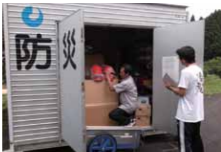
▲自治振興会による防災倉庫点検

朝宮自治振興会では、地域の活性化と、文化・事業の継承と発展をめざし、今年度から組織が次の通り大きく改編されました。 ①防災、防犯に対応できる町づくり(防災防犯部会) ②地域の長期、中期、短期課題の検討(地域課題検討部会) ③広報紙の発行継続とホームページ開設検討(地域広報部会) ④住民交流や子育て支援等の拠点づくり(地域交流推進部会) ⑤地域の文化財、埋蔵文化財保存活動(文化振興部会)などです。 これらの新しい取り組みと、敬老会や体育大会、文化祭など既存の継続事業が、地域の皆さんの力により一層盛り上がり、地域の活性化につながればと思います。