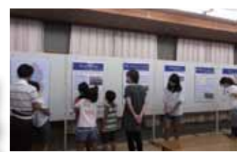
▲熱心にパネルを見入る見学者

岩上地域市民センターでは、平和への願いをいつまでも持ち続けるために「戦争体験パネル展」を開催しました。 パネルは、滋賀県平和祈念館が所蔵し、市内の戦争体験者の証言を記録したもので、戦地での体験や工場での勤労体験が記されています。 子ども達や高齢者の方まで多くの皆さんに見学に来ていただき、子ども達からは「戦争中はつらい生活だった」、「戦争は一度と起こってほしくないと思った」などの感想が聞かれました。 時が経つにつれ、戦争を体験した方が減っていきますが、いつまでも戦争の悲惨さと平和の大切さを伝えていかねばならないと思います。