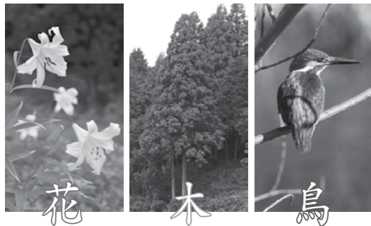
花 ササユリ 木 スギ 鳥 カワセミ