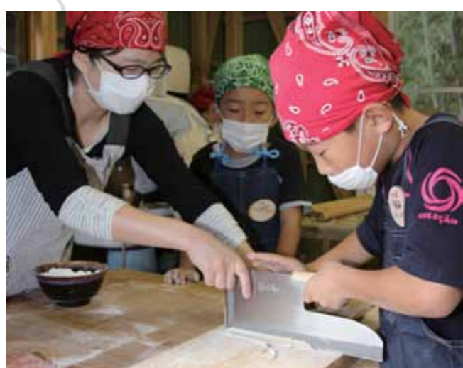
▲均等になるよう生地を切り分ける親子

信楽町のNPO法人ふれ愛パークで9月28日、親子15人が信楽産のそば粉を使ってそば打ちを体験し、茹でたてを味わいました。 小学生を対象に信楽中央公民館が行うものづくり教室「遊学舎」の3回目で、同法人の会員の皆さんが講師となり実施されたものです。 生地を練り上げた後、均等に伸ばして切り分けるまでをグループで行い、アドバイスしたり励ましたりと力を合わせてそばに仕上げました。 参加者は、「コシがあつて美味しい」と格別なそばに舌鼓を打っていました。