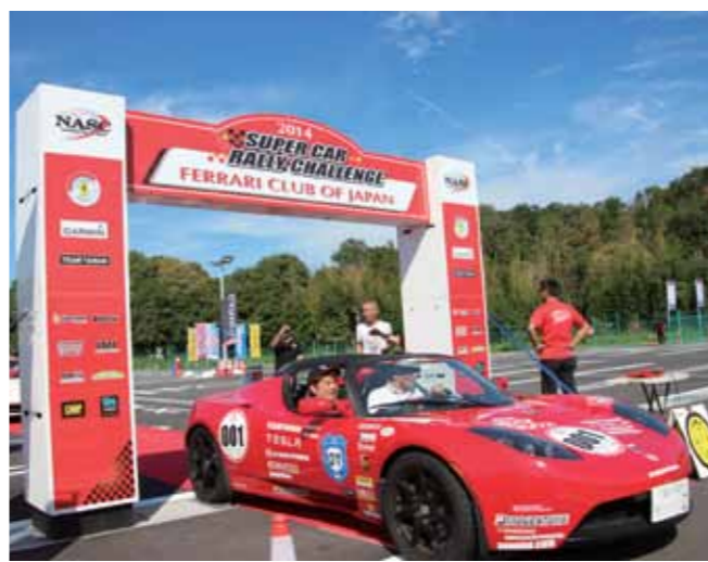
▲水口会場に到着したスポーツカー

長浜市から甲賀市までを、クラシックカーなど約40台が走るClassic Car & Super Car「LAKE BIWA Rally」が9月21日、開かれました。 まちを元気にしたいという思いから「鹿深ふるさと元氣隊」が初めて開催したものです。チェックポイントの一つ水口町の日立建機テイヤラ駐車場では、走行タイムの正確性を競う競技が行われ、訪れたファンを魅了しました。 また、名車の展示や水口岡山城のバルーン、グルメカーなども用意され、多くの家族連れでにぎわいました。