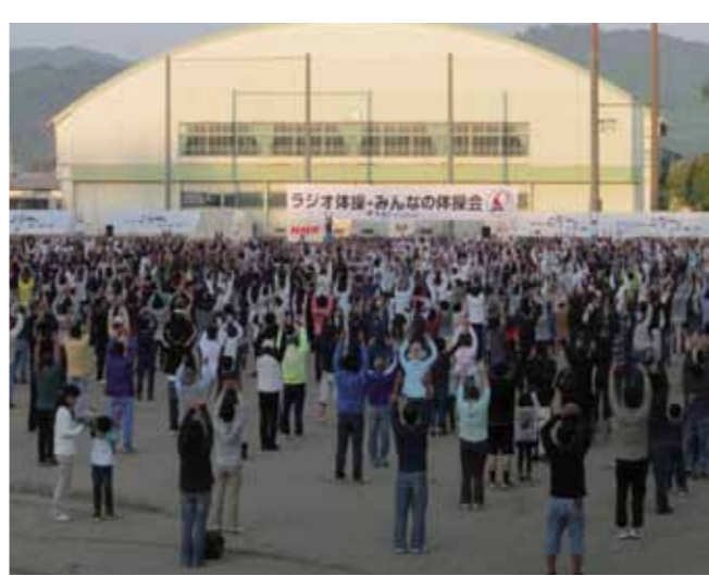
▲全国へ生放送された甲南グラウンドでのラジオ体操

特別巡回「ラジオ体操・みんなの体操会」が9月28日、甲南グラウンドで開催され、地域の皆さんはじめ1500人を超える多くの方が参加しました。 NHKラジオで生放送されるとあって会場に緊張感が漂う中、講師にならって身体をすみずみまで動かし、元気な掛け声を全国に発信しました。 また、スポーツ推進員が、手裏剣やタヌキの腹鼓の動きを取り入れたオリジナル体操を紹介し、参加者は、楽しみながら気持ちのいい汗を流しました。