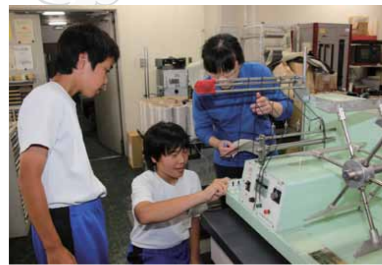
▲品質検査の手順を教わる生徒

生徒は、「手順を少しでも間違えると正しい数値が出ない」と、指導者に聞きながらやり直し、真剣に取り組んでいました。