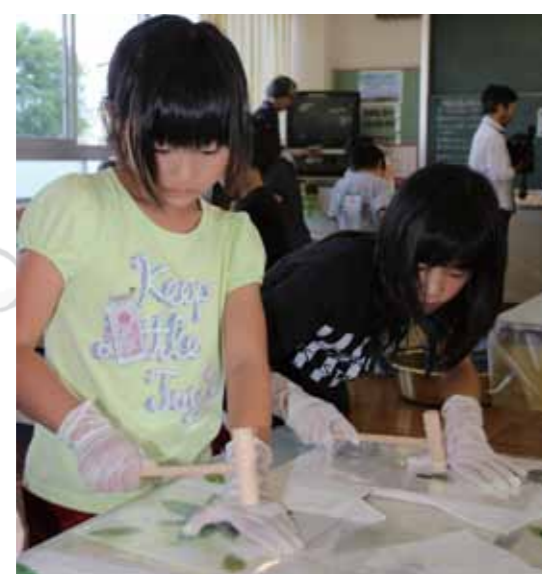
▲木づちで叩く「たたき染め」に挑戦する児童

水にさらすときれいな藍色に染まったハンカチに児童は歓声を上げ、植物の不思議を実感していました。