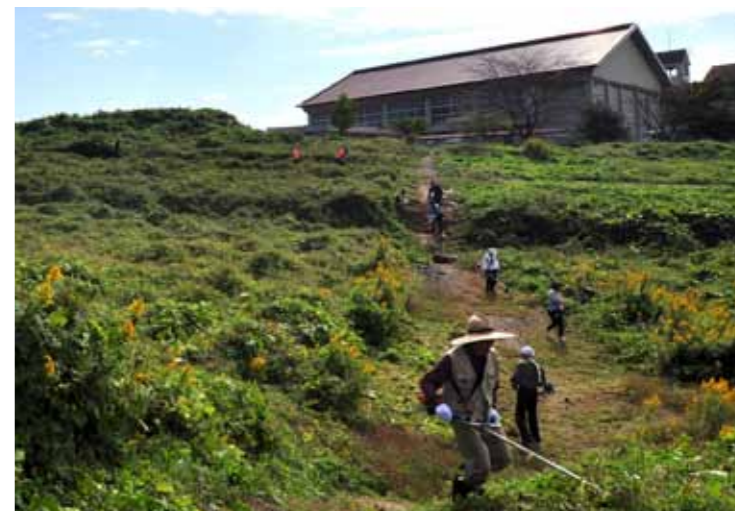
▲広大な「冒険の丘」の草を刈る参加者

またお昼に合わせて、地域の子育てサークルによる炊出し訓練も行われ、参加者は疲れた体を温かい食べ物で癒していました。