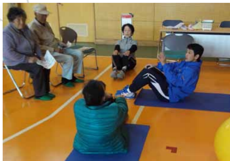
▲運動指導を熱心に受ける参加者

体力測定やニュースポーツが体験できる「ふれあいゆるスポフェスティバル」が11月16日、土山体育館で開催され、子どもから高齢者までたくさんの方が訪れました。 スポーツに親しみ、健康づくりのきっかけにと甲賀市スポーツ推進委員会が実施しました。参加者は、体力年齢などの測定結果に一喜一憂し、スポーツ指導員による運動指導を熱心に受けていました。また、ラジボール卓球などニュースポーツも数種目用意され、身体を動かす楽しさを知る一日となりました。