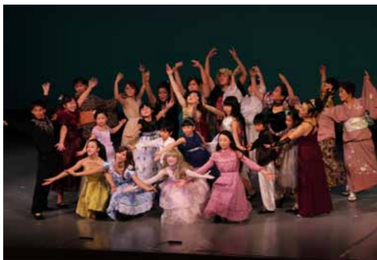
▲40人が演じる感動の舞台

平和への願いを込めて、4歳から79歳までのキャスト40人が熱演し、ひとつとなった力強い歌声に、満員の会場が感動に包まれました。