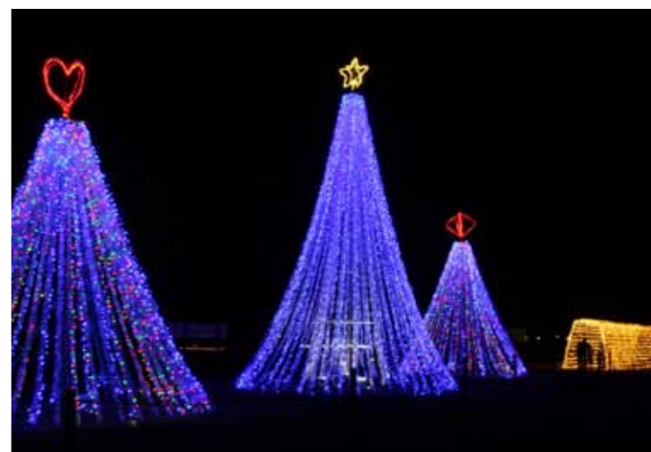
▲幻想的に輝くペットボトルイルミネーション

カウントダウンの後現れた青や温かみのある黄色の幻想的な光に歓声が上がりました。毎日17時から22時まで、来年1月30日までの期間実施しています。