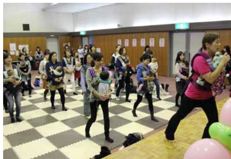
▲ダンスを通してコミュニケーション「ベビータンク」を体験する参加者

子育て応援フェスタが11月28、29日の2日間、サントピア水口で開催され、市内外から約1千組、3千人が訪れました。 この催しは、地域全体で子育てを応援する機運を高めようと、3つの子育て支援団体が参加する実行委員会が主催しました。 会場では、ベビータンクをはじめ赤ちゃんとお楽しみ体験プログラムやママのためのリフレッシュメニューなど、子育てを楽しむ機会となるよう様々なイベントが用意されたほか、約50店舗が並ぶ手作り市も開かれ、大勢の親子連れで賑わいました。