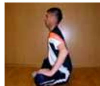
▲両膝を手で地面の方向へ

問い合わせ 文化スポーツ振興課 スポーツ振興係 ☎86-8023 / ☎86-8380