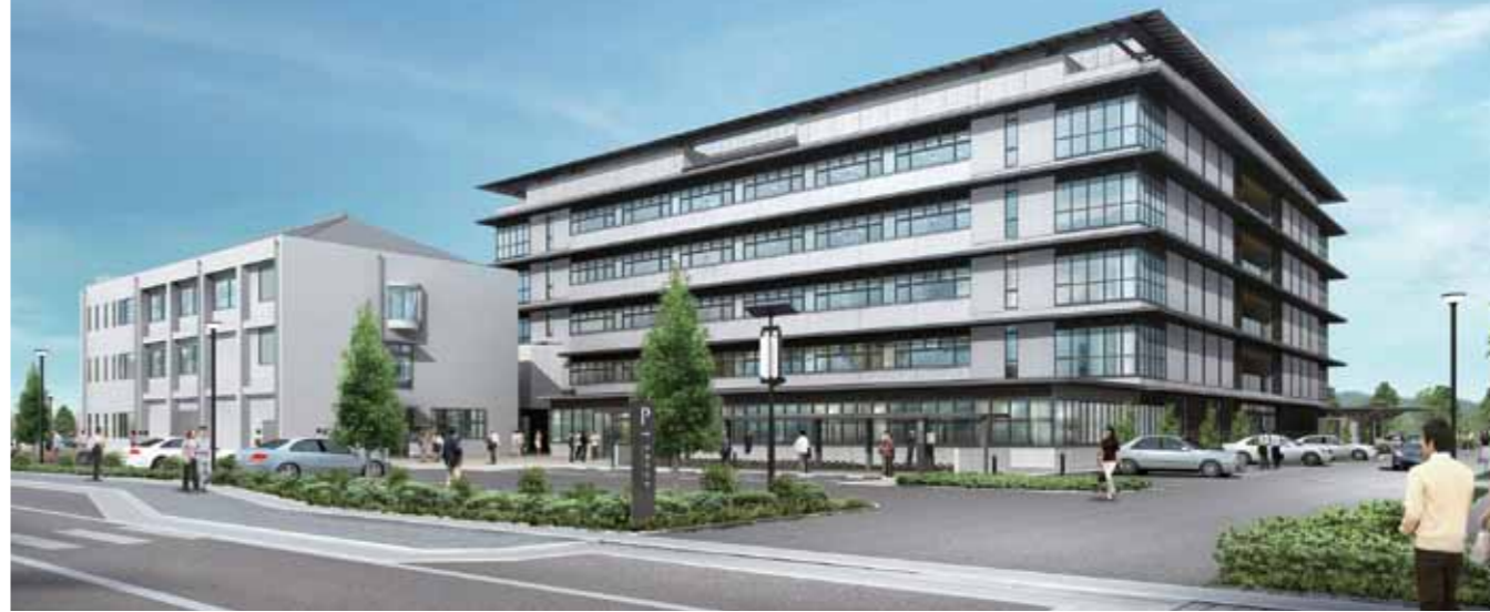
▲北側外観イメージ

市役所の庁舎建設に関する入札執行に伴い、6月24日に行われた市議会にて契約案件が議決されました。これにより、本年7月から平成30年1月までの31カ月に渡り新庁舎の建設工事を実施します。