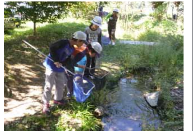
▲活動を楽しむ児童たち

児童自らの主体的な環境学習・保全活動に取り組みと、地域ぐるみの環境保全行動が高く評価されたこのたびの表彰につながりました。