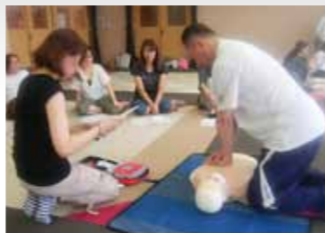
▲普通救命講習会の様子

「救急の日」は、昭和57年に救急医療及び救急業務に対する国民の正しい理解と認識を深め、救急医療関係者の意識の高揚を図ることを目的に定められました。以降、毎年9月9日を「救急の日」とし、この日を含む1週間を「救急医療週間」とされています。