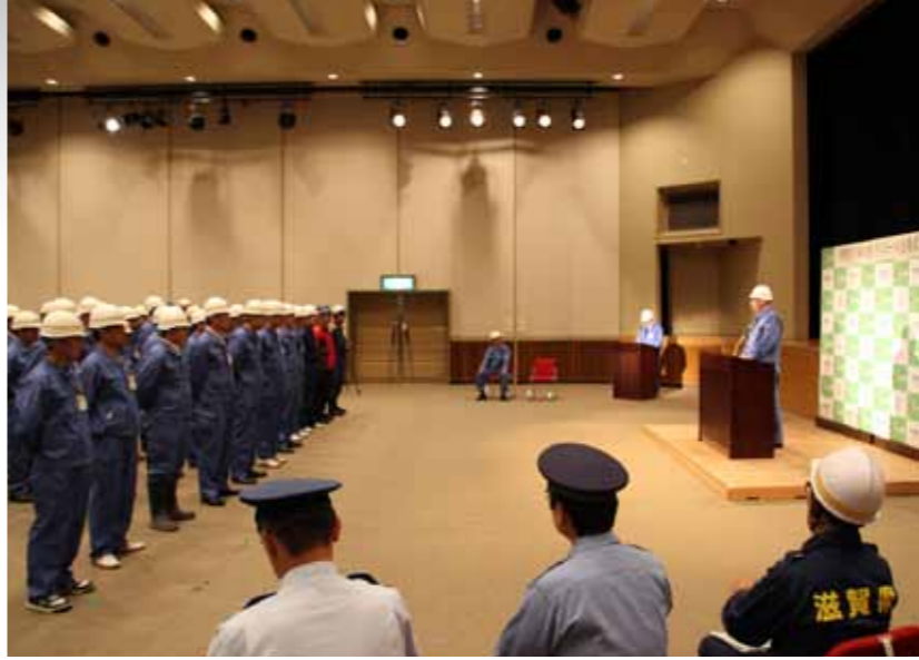
▲土砂災害パトロール出発式の様子

昨年8月に広島市で発生した大規模な土砂災害は、近年各地で頻発する局地的豪雨への心配が現実化した一例であり、同様の事態が全国各地で発生しても不思議ではありません。 本市においても、土砂災害警戒区域が616カ所あり、土砂災害が発生する危険性をはらんでいます。