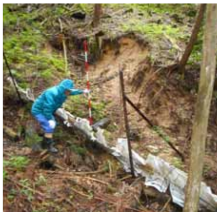
▲地滑りの発生しやすい危険箇所

今回のパトロールで、150カ所あまりが継続して観察していく必要があることが分かりました。 今後収集した情報を基礎として、さらに情報を蓄積していくことで、より効果的な防災対策へつなげていきます。