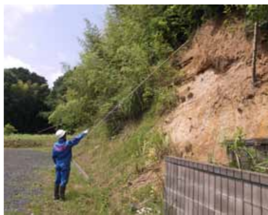
▲崩壊の危険がある法面

河川の氾濫防止や土砂災害予防のための施設整備が整うには長い期間が必要であり、整備されても完全ではありません。