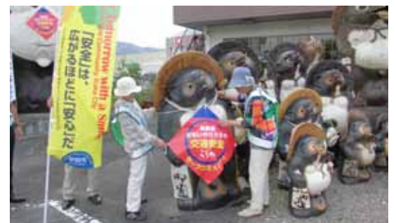
▲「おもいやりタヌキ」を設置する対策委員

18店舗に設置しました。設置した店舗の協力もあって多くの方にアピールすることができ、地域の交通安全意識の向上につながりました。今後は他の地区にも取り組みを広げていきたいと考えています。