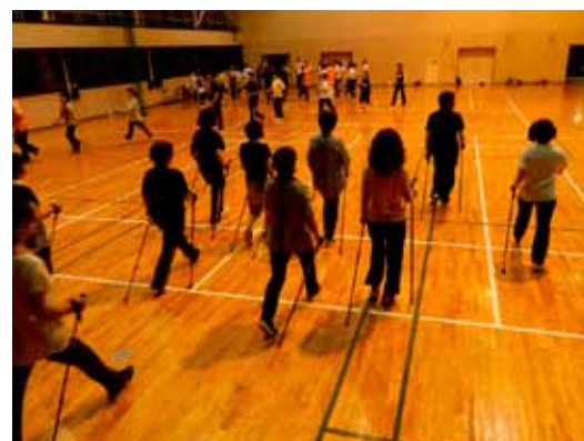
▲ノルディックウォークを体験する参加者

人口減少社会を迎えて 学区内の区長、自治会長を含め44人が出席した5月30日の研修会では、市の甲賀の國づくりプロジェクト推進室職員を招き、「わが街の人口減の現状と対策」と題して勉強会を開催しました。 大原自治振興会では、近年の少子高齢化を背景とする地域社会の変化を深刻に考え、今年度「空王さま」「若者」「見守り」「防災」などをテーマにメンバーを募り、新たなプロジェクトを立ち上げました。行政とも連携を図り、人口減少社会に立ち向かっていきたいと考えています。