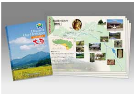
▲「ふるさと再発見 大原」

問い合わせ 大原自治振興会 (甲賀大原地域市民センター内) ☎・☎8833111