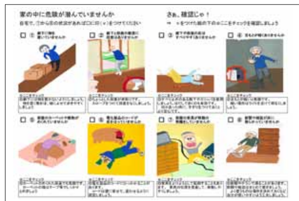
▲転倒予防のチェックリスト

転倒予防の意識啓発として、転倒予防のチェックリストを作成し、地域包括支援センターなど各種団体が持っている高齢者宅の訪問と併せて配布しています。