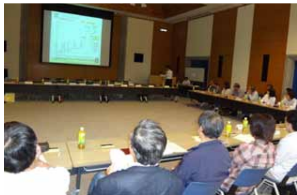
▲勉強会で人口シミュレーションを熱心に聴く参加者

住民一人ひとりが強い結びつきのなかで、だれもがこれからも住み続けたいと願う、元気で力強い地域社会の実現をめざして活動しています。