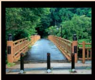
東海道の道しるべ 「『かいどうばし』は三文なり」

毎回子どもたちが嬉しそうな笑顔を見せてくれることが、私たちの活動の糧になっています。