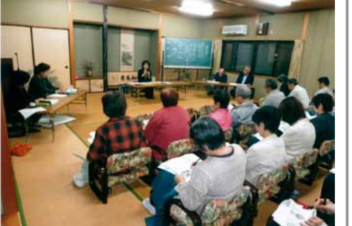
▲区民で学んだ糖尿病予防