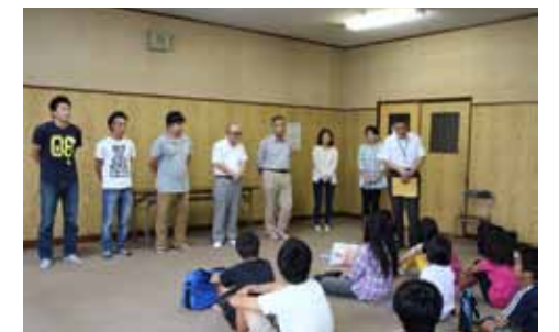
▲開校式でのスタッフ紹介

生活支援課 生活支援係 ☎ 65-0735 / ☎ 63-4085 ✉ koka10253025@city.koka.lg.jp