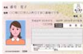
▲個人番号カード(ICカード)