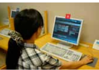
(表示画面: 国立国会図書館デジタルコレクションウェブサイト)

4月1日から市内の図書館で「国立国会図書館デジタル化資料送信サービス」が利用できるようになりました。このサービスは国立国会図書館でデジタル化されている資料のうち、インターネット公開されておらず、絶版等の理由で入手困難な資料約137万点を図書館内のパソコンから閲覧することができるサービスです。より多くの貴重な資料をご覧いただける機会ですので、ぜひご利用ください。(市内の図書館では複写はできませんのでご了承ください。)