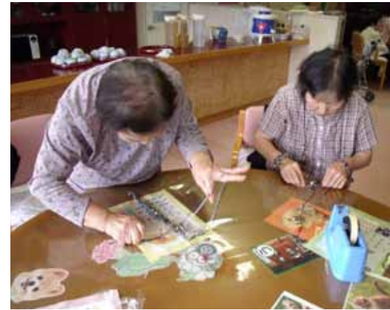
▲思い思いの反射材を作る利用者

そこで、反射材の啓発と併せて、簡単に靴に貼れるシールタイプの反射材を作成して配布したり、高齢者施設の利用者