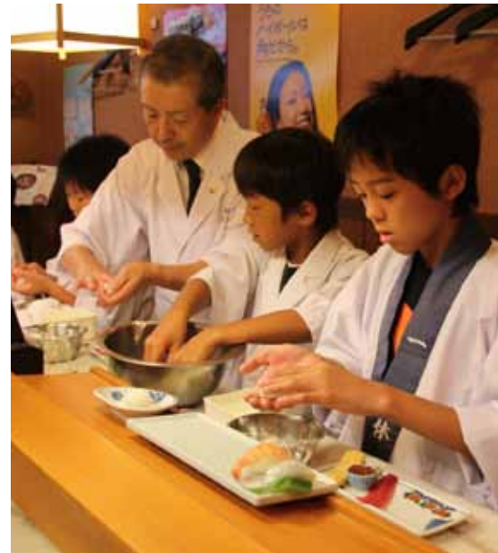
▲初めてにぎり寿司に挑戦する子どもたち

寿司屋でお仕事体験をした5人の子どもたちは、手にご飯がくっついた海苔が破けたりと苦戦しながらも、地域で働く寿司職人の技を見習い、仕事の難しさや楽しさを学びました。