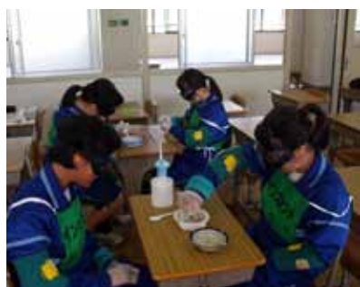
▲装具を着けて疑似体験をする生徒

この体験の修了者には、修了の証としてリストバンドをつけます。リストバンドが増えることで、高齢者が外出しやすくなるように努めています。