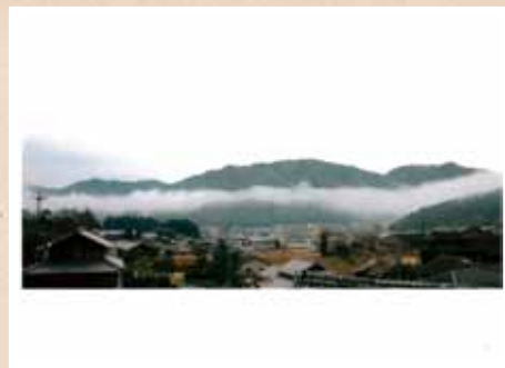
陶都の山容 「みまもる」