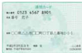
▲通知カード（紙のカード）

A 12桁のマイナンバーが書かれた通知カードと、個人番号カード交付申請書、申請書送付用封筒、簡単な説明書が届きます。