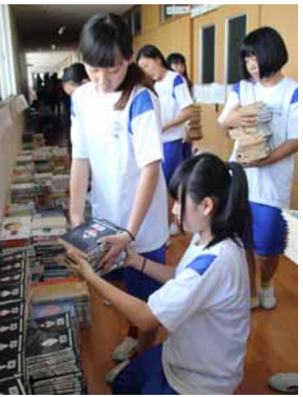
▲本を廊下へ運び出す生徒

二学期から多様な学習ができるようになった図書室の活用に、参加した生徒は期待を膨らませていました。