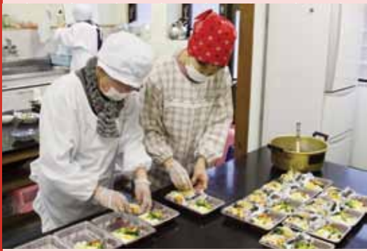
▲「ささえ愛弁当」を作るメンバー