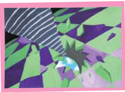
宇宙の上の別世界

このコーナーでは、市内の保育園・幼稚園・小中学校の児童や生徒が描いた絵を順次紹介していきます。