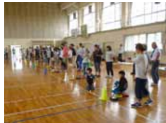
▲カローリング大会

カローリング大会 今回は、「子どもは地域の宝」をコンセプトに青少年の健全な育成を目的とした事業の一部を紹介します。いずれの事業も子どもたちが地域の大人とふれあい顔見知りになり、笑顔で挨拶できることをめざしています。 氷上のスポーツ「カローリング」からヒントを得て生まれた屋内型の「ユニスポーツ」です。最初は初めての体験で戸惑いもあり、ぎこちなかった子どもたちも、競技が進むにつれ、大人に負けず劣らずプレイしています。