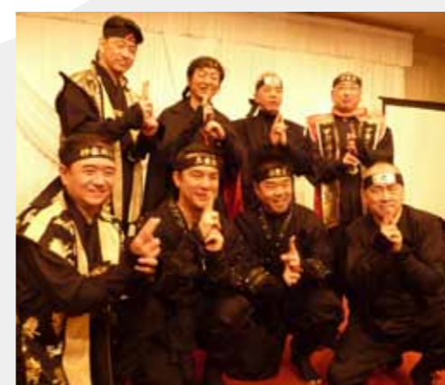
▲日本忍者協議会設立記者会見の様子

「忍者の日」 2月22日の前後には、甲賀流忍者復活の狼煙を上げるため、まずは3つの取り組みを実施します。