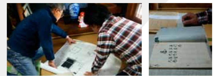
▲忍者の子孫のお家で古文書を調べる調査団

甲賀流忍者調査団「ニンジャフラインダーズ」は、「本物の忍者」を求めて調査するプロジェクトチームです。「甲賀流忍者復活祭」では現在進めている調査についての途中経過を発表します。 調査はこれからも継続されますので、「内容は分からないけど家に古文書がある」「うちには忍者の子孫らしい」など忍者に関わると思われるものがあれば、お気軽に情報をお寄せください。