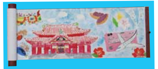
修学旅行の思い出