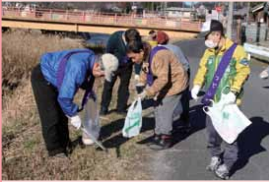
▲河原のゴミ拾いをする会員ら