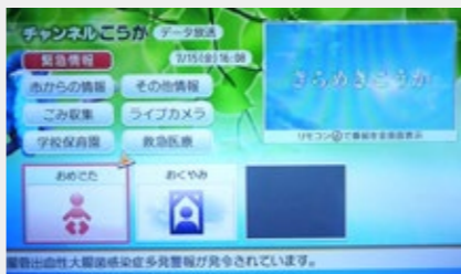
▲チャンネルこうかデータ放送画面

た。「情報の道」を活用した光テレビでは、コミュニティサービス機能として「データ放送画面」や「甲賀市メニュー画面」をご利用いただくことができます。「データ放送画面」では、市からのお知らせや募集情報、おめでた・おみやみ情報などのほか、市内18カ所（道路・河川等）に設置している監視カメラからの映像を通して、台風時等の市内状況をご覧いただくことができます。