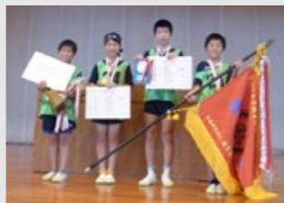
▲優勝した大原小学校の児童

6月18日に滋賀県立体育館で「第43回交通安全子供自転車滋賀県大会」が開催されました。