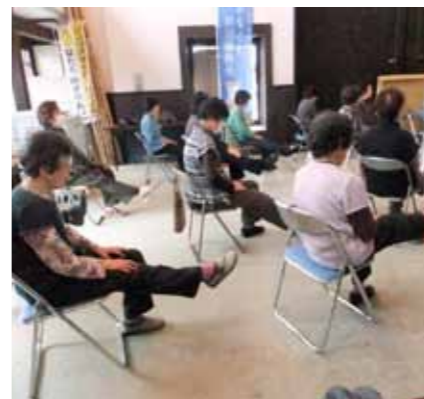
▲週に一度のいきいき百歳体操

地域の高齢者を対象とした「いきいき百歳体操」を平成25年3月から始め、多くの方の参加を得ています。この体操は全国的に展開されており、隣接する綾野自治振興会も同時期に始められています。 当初は高齢者の体力を維持するきっかけづくりという目的がありましたが、現在では「参加することが楽しみ」、「病院にかからなくなった」といった参加される方々から喜びの声をたくさんいただいています。