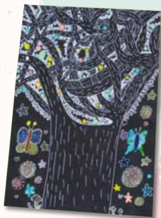
ふしぎの木と生き物たちのカーニバル!!

これからもできるだけ多くのイベントに出向いて、多くの方に元気を与えられる演奏をめざしながら、メンバー一人ひとりがいつまでも生き生きと輝き続けられるような活動をしていきたいと思っています。