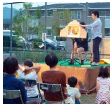
▲サークルメンバーによる紙芝居の上演

化は、サークルメンバーにとって大きな励みとなり、現在、新たな作品を制作しています。 子ども会や老人会など地域での会合であれば貸し出しも可能です。関心をお持ちの方はお問い合わせください。