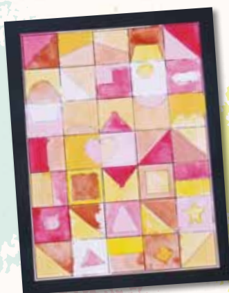
もようづくり「スイーツ」