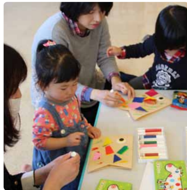
▲こいのぼりに色をつける親子

未就園児を対象とした「キッズランド こいのぼり作り」が4月19日、甲賀子育て支援センターで催されました。この日は14組の親子が参加し、紙でできたこいのぼりに色とりどりの折り紙を貼り付けたり、カラーペンで色を塗ったりと、思い思いのこいのぼりを作りました。子どもたちは出来上がったこいのぼりをうれしそうに眺めながら、最後はみんなで「こいのぼり」の歌を歌い、少し早く「こいのぼり」を楽しみました。