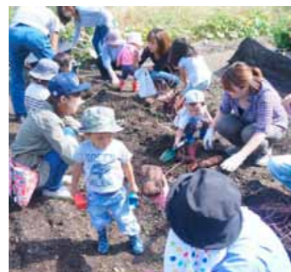
▲親子でいも掘り体験

絵手紙を学ぶサロンや歌を歌うサロン、野菜をつくる菜園サロン、男性のものづくり集団GG工房サロン、子育てを支援する子育てサロンが少しずつ広がりを見せています。 その中でも、絵手紙を学ぶサロンは、自主運営をするため「ひこそこめ絵画サークル」として集立ち(平成25年4月)、歌を歌うサロンも「歌声サークル」として再スタートするに至っています。