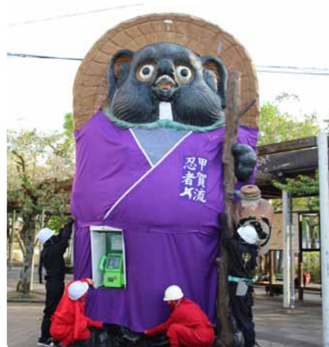
▲忍者による大たぬきの忍者衣装の着せ替え

胸元に「甲賀流忍者」と書かれた紫色の忍者衣装に身を包んだ約5メートルの大たぬきは、5月末まで信楽駅で観光客をお迎えします。