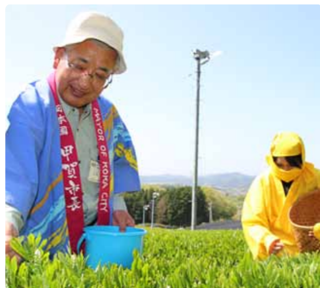
▲茶摘みを行う中島市長と忍者姿の摘み子