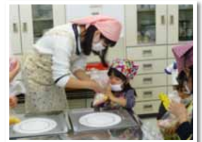
▲調理体験をしている親子

問い合わせ こども未来課 指導振興係 ☎ 86-8171 / ☎ 86-8380