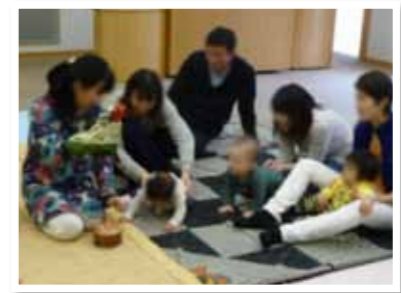
▲ふれあい遊びを楽しむ親子

子どもに一人ひとり個性があるように、親にも個性があり、家族の形も違います。気軽に事業へご参加いただくことで、子育てのヒントが見つかり、成長の喜びや楽しみにつながれば幸いです。