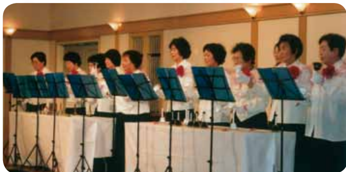
▲地域のイベントでハンドベルを演奏するメンバー