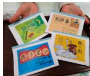
▲紙芝居のミニ絵本も完成

当振興会の各種活動が最初は小さな種もいずれば大きな木になり、さらに根や枝となって広がっていく、それが地域の元気の源となることを願っています。