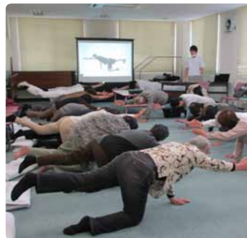
▲理学療法士指導の体操に挑戦する参加者