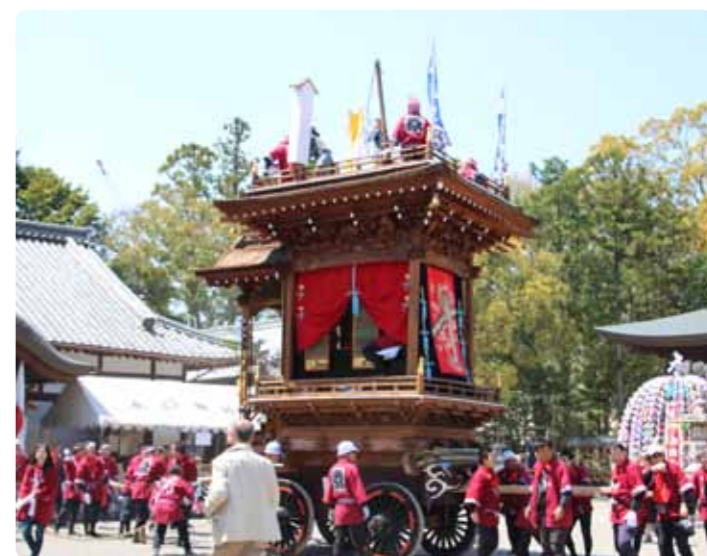
▲水口神社に到着した曳山