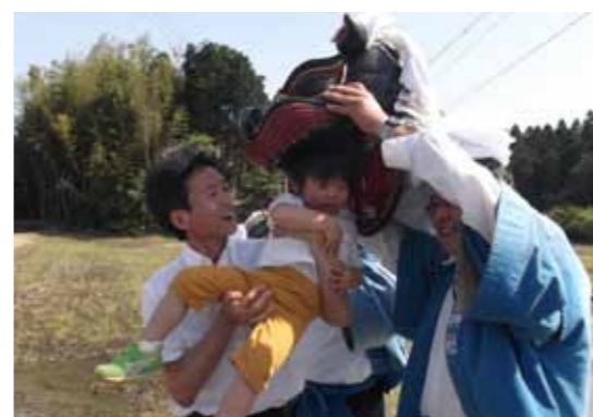
▲健やかな成長を願った伝統行事

伴中山にある三十八社には、石の太鼓橋があります。この橋ができたのは、江戸時代元禄年間(1688年~1704年)と云われています。地域では「下馬橋」と呼ばれ、殿様でもこの橋の前では馬から下りなければならないとのことからきています。市内にもたくさんの石の太鼓橋がありますが、川や池に架かっていない橋は、全国的にもめずらしいようです。