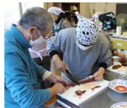
▲鹿肉を調理している様子

また、捕獲した鹿肉を活用したジビエ料理開発や獣の住家となる耕作放棄地に少果樹「アロニア」を作付し特産化をめざす取り組みなど有害鳥獣被害を大幅に軽減する対策と山内夢づくりとして地域活性化対策を連携して行っています。