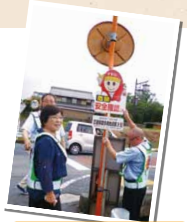
注意看板を設置する委員

セーフコミュニティ交通対策委員会で実施された啓発チラシの配布や事故多発地点での注意看板の設置などの取り組み効果や高齢者の交通事故防止対策について伺いました。