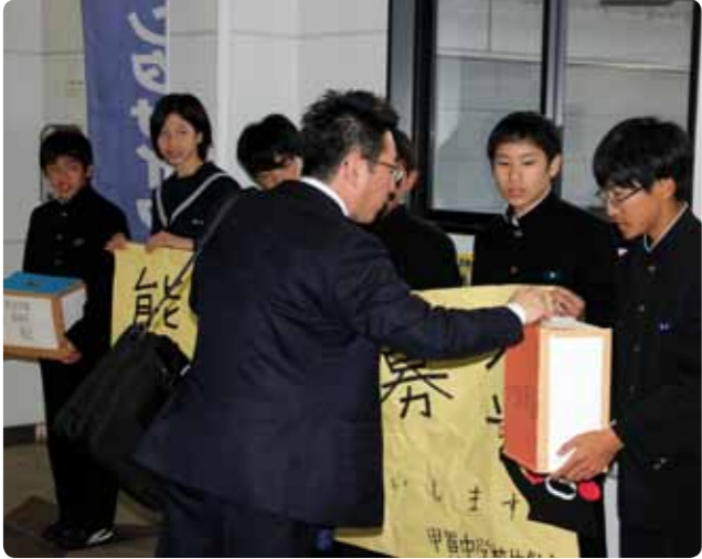
▲改札口前での募金活動