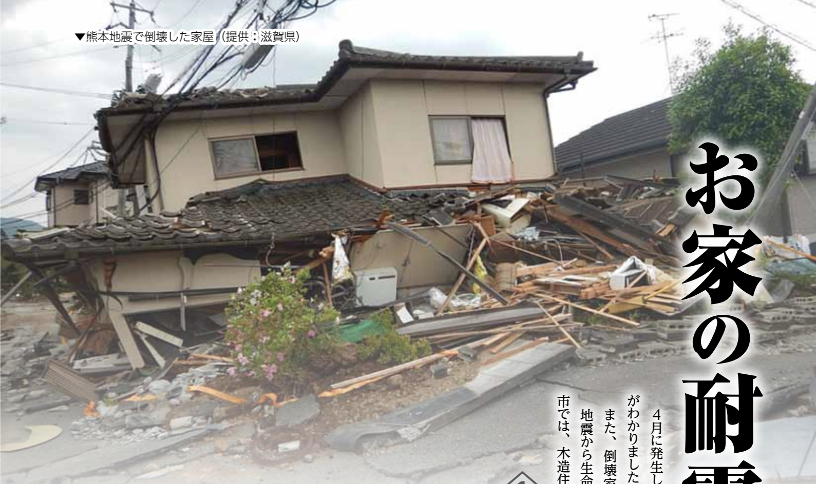
▼熊本地震で倒壊した家屋

また、倒壊家屋の半数以上が、耐震基準の変更となる昭和56年5月以前に建てられたことも判明しています。地震から生命や財産を守るためにも住宅の耐震化は、震災時の被害を抑えるために最も有効な手段とされています。市では、木造住宅の無料耐震診断と耐震改修を支援しています。