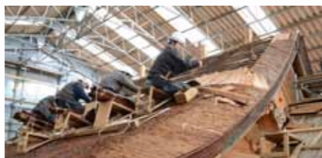
▲文化財修理には多くの職人さんの伝統的な技術が使われています。

修理事業は本年十二月末に完了予定となっています。伝統の技で見事に生まれ変わった本殿に出会えるのを楽しみに、今しばらくお待ちください。