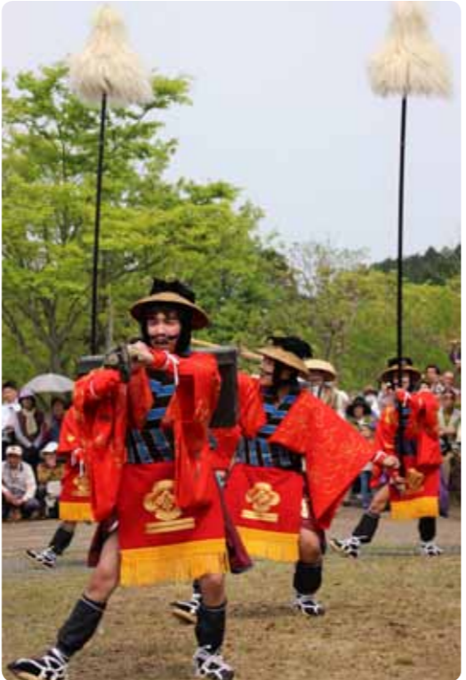
▶華やかな衣装に身を包んだ花奴

甲賀町の油日神社で5月1日、5年に1度奉納される「奴振り」が奉納されました。「頭殿」と呼ばれる祭主のお供の行列で、総勢約250人が町内を練り歩きました。道中では、長持を担いだ長持奴や、華やかな衣装を身にまとった花奴などが、独特の歌や身振りを披露し、見物客を楽しませました。訪れた人は、「勇壮で伝統のある祭りが地域の方々によって継承されていることが素晴らしい」と感心していました。