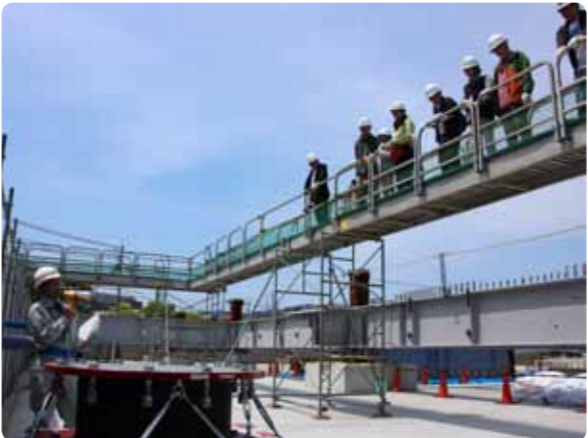
▲免震装置の説明を受ける見学者

市新庁舎現場見学会が、4月30日に水口庁舎敷地内の工事現場で開催され、かふか21子ども未来会議のメンバーや一般公募による市民が参加しました。新庁舎には、信楽焼や地元産のスギ・ヒノキなどを使用し、市の文化や地域の特色を取り入れた開放感あふれる庁舎となるよう設計されています。また、防災拠点としても機能する庁舎となるため、免震構造を採用し、太陽光などの自然エネルギーを取り入れる整備も行います。参加者は、普段見る機会のない工事現場の様子を真剣な表情で見ました。