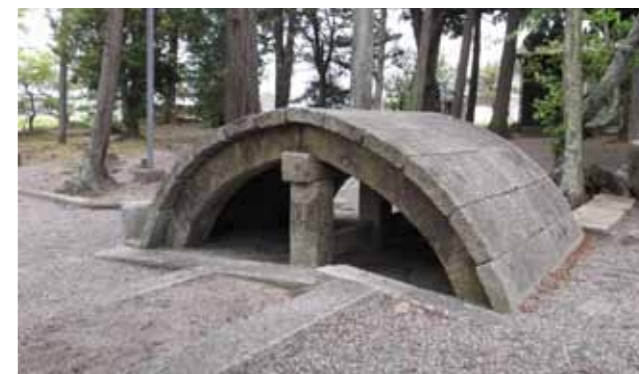
▲三十八社の石の太鼓橋