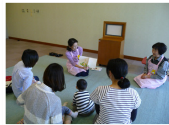
▲乳幼児おはなし広場(土山)の様子

参加された方の中には帰りに図書館で絵本を借りて帰る方もおられます。予約はいりませんので、ぜひ、気軽にご参加ください。