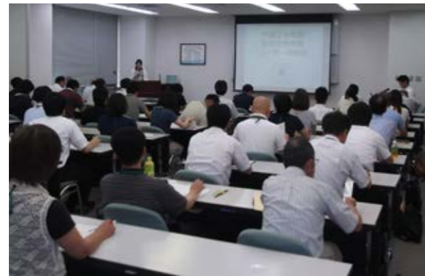
▲安全管理推進リーダー研修会の様子

平成24年から取り組みを進めているセーフコミュニティの「子どもの安全対策委員会」では、過去の事故や具体的な統計から、小・中・高校生