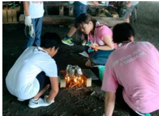
▲「ニンニン忍者キャンプ」で野外調理を学ぶ参加者

が、それらを運用するのは私たち一人ひとりの人間であり、組織です。そのことを深く自覚した上で、市民・地域・団体・関係機関等による横断的な連携とPDCAサイクルによる継続的な改善を行い、セーフコミュニティの仕組みを活用し、まち全体に広げながら安心安全なまちづくりをさらに進めていきます。