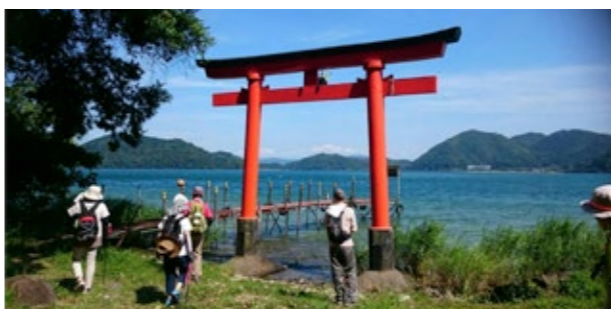
▲沖島を散策する参加者