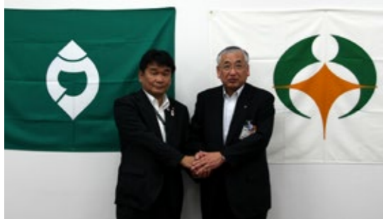
▲締結式での宇治田原町長(左)と中嶋市長(右)

京都府宇治田原町との「災害時相互応援協定」締結式が8月1日、市役所水口庁舎で行われました。 本市は、県内の全市と県市長会災害相互応援協定を結んでいますが、県外の自治体と単独で協定を結ぶのは伊賀市に次いで2例目です。 この協定は、災害発生時における救護物資や資機材の提供、支援職員の派遣など相互の応援協力を行うものです。隣接する自治体が協力関係を結ぶことでお互いに迅速な対応ができる効果が期待されます。