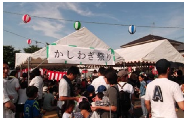
▲来場者でにぎわう「かしわぎ祭り」

かしわぎ祭り 「柏木地域市民センター」 かしわぎ自治振興会設立5周年記念事業「かしわぎ祭り」が、6月18日に開催されました。会場となった柏木公民館駐車場には模擬店が並び、和太鼓の演奏や子どももつぎ大会、ペルーのダンス「マリネラ」と中国のチャイナドレスショーといった国際文化交流イベントもあり、多くの来場者でにぎわいました。 当日は、記念式典も行われ、地域の功労者へ感謝状の授与が行われました。