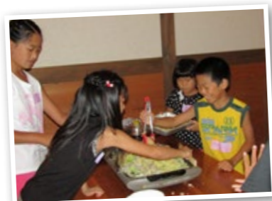
▲協力して焼きそばを作る子どもたち

食後は、子どもたちが待ちに待った工作タイム。「物かけフック」や「ビー玉転がし」を作ります。