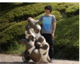
▲安藤祐輝「夜明け前の歓喜」