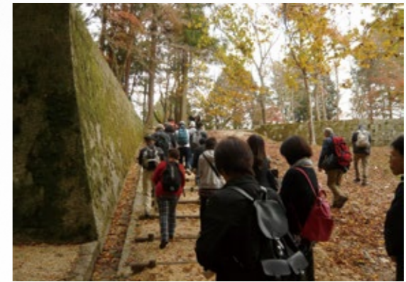
▲昨年の秋季公開の様子

今回の秋季公開では、初めての方はもちろん、リピーターの方にも多羅尾代官陣屋跡の新たな姿を楽しんでいただけることでしょう。 ぜひ、秋の多羅尾に出掛けてみてはいかがでしょうか。