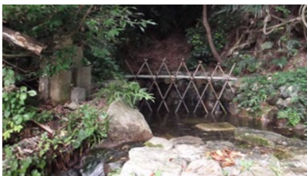
▲倭姫命に献上されたと伝えられる御場泉

御場泉の場所は、大野地域市民センター（〒6700001）までお問い合わせください。