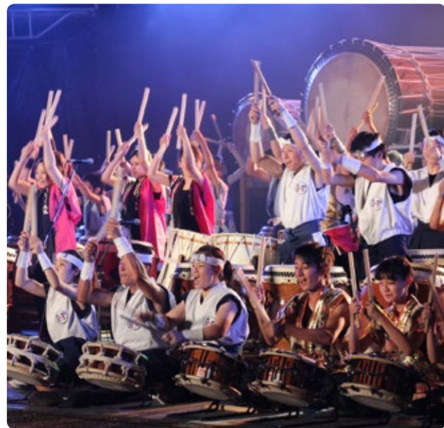
▲フィナーレの100人太鼓