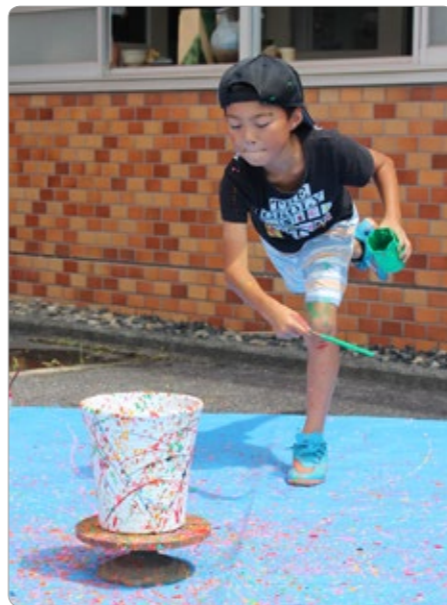
▲筆を投げおろして絵付けする児童

参加した児童らは、筆以外にもスポンジや自分の指や手を使って絵付けし、「自分の作品がすぐわかるように描いた」と秋の展示を心待ちにしていました。