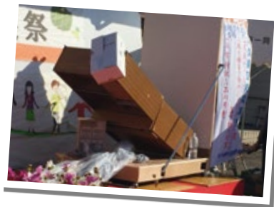
手作り起震台で転倒および防止実験

地震の揺れだけでなく家具等が実際に倒れてくる怖さを体感してもらおうと、区内で組織する自主防災推進委員会が、人力で揺れを再現する手作り起震台を製作しました。