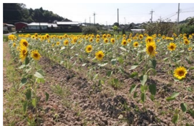
▲満開のひまわり畑