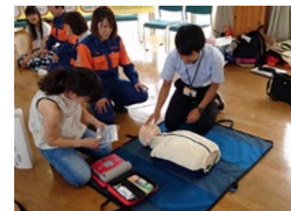
▲AEDを使用した講習会

先ほどまで元気にしていたのに、突然、倒れた。心臓や呼吸が止まっている。このような時に命を救えるのは、そばに居合わせた人が救命処置（心肺蘇生法）を行うことです。それにより生存率や社会復帰率がとて高くなります。甲賀広域行政組合の各消防署・分署ではAED（電気ショック）を使用した心肺蘇生法の普通救命講習会を行っています。「いざという時」に自信を持って救命処置ができるよう心肺蘇生法を身につけましょう。講習については、最寄りの消防署・分署にお問い合わせください。