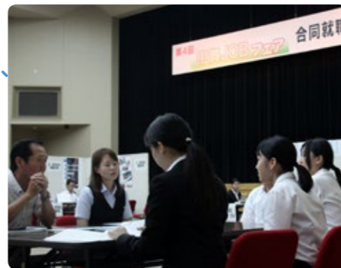
▲企業から説明を受ける求職者

今年は、初めて同フェアを市外でも開催し、求職者の就業の促進と市内企業の活性化を図っています。