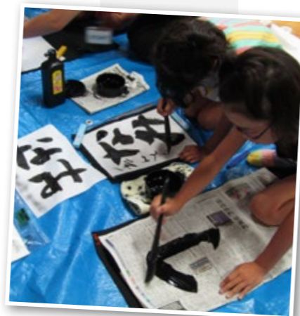
▲集中して習字する子どもたち

空けるのが初めての子や、のこぎりで木がうまく切れない、釘を打つと曲がってしまうなど悪戦苦闘しましたが、周りのみんなと助け合いながら一生懸命に取り組む姿は真剣そのものでした。縦割りでの異年齢交流での体験を終えた子どもたちはひと回り成長した様子でした。