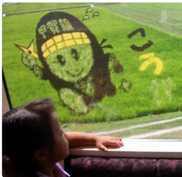
▲見ごろを迎えた「にんじゃえもん」の田んぼアート

見ごろは10月8日の稲刈りまで、信楽高原鐵道に乗車し、車窓から甲賀流田んぼアートをご覧ください。