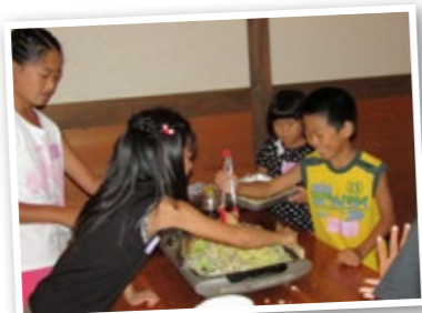
▲協力して焼きそばを作る子どもたち

食後は、子どもたちが待ちに待った工作タイム。「物かけフック」や「ビー玉転がし」を作りま