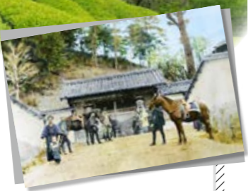
▲多羅尾代官陣屋跡