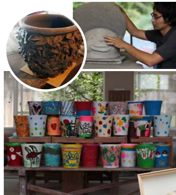
▲あつまれ!!みんなの植木鉢