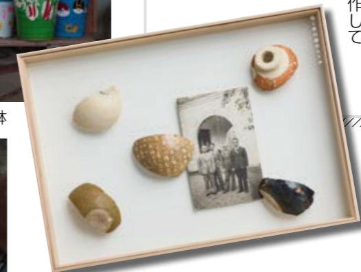
▲信楽物語 中村裕太作「日本陶片地図」