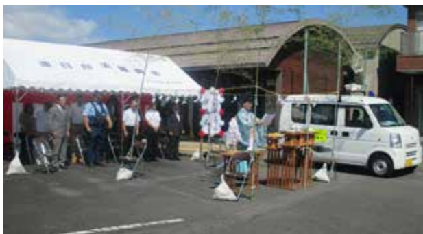
▲青色防犯パトロール出発式

青色防犯パトロール出発式が7月6日、油日自治振興会で行われました。 子どもへの声かけ事案などが発生したことから、区・自治会に呼びかけ、学区内の住民49人が地域内の巡回に参加されています。 油日自治振興会では、「活動は長く続けて、地域の一体感や活性化にもつなげていきたい」と考え、週1回のペースで通学路の危険な場所など青色灯を回してパトロールしています。