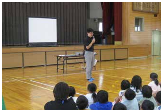
▲おまわりさんといっしょに「いかのおすし」