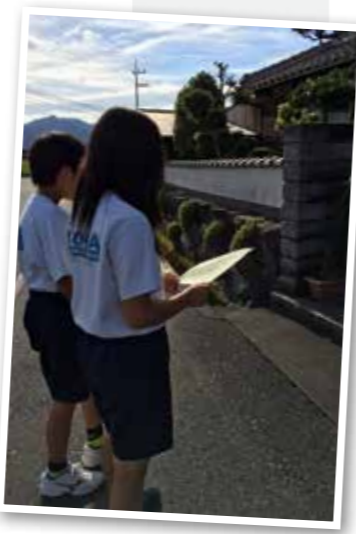
▲各家庭にお願いの用紙を配布