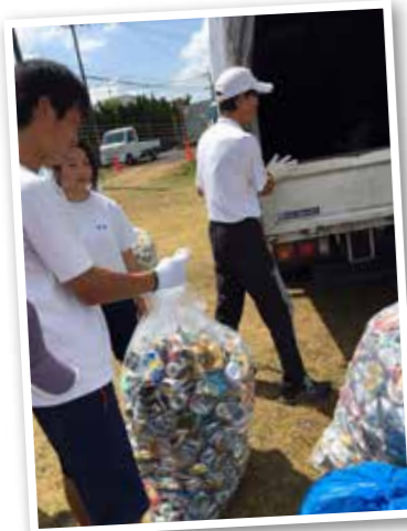
▲地域ごとにアルミ缶を回収

地域の協力を得て 生徒も保護者も一緒に アルミ缶回収ボランティアは、地域の皆さんとのふれあいを通じて社会性を培うとともに、ボランティア活動を行うおうちとする心を育てることを目的として行われています。甲賀町内の家庭の協力により続いており、今年で16年目になります。 1カ月前に、中学生がアルミ缶回収のお願いの用紙を自分たちの地区の各ご家庭に配り、回収までにそれぞれのお家でアルミ缶を水洗いしてつづいてもらいます。 当日の朝、子どもたちとその保護者が各