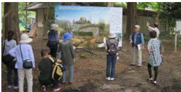
▲説明版前での研修の様子

歴史遺産を活かしたまちづくり 【多羅尾地域市民センター】 多羅尾代官陣屋跡保存会・多羅尾自治振興会では、地域が誇る「多羅尾代官陣屋跡」の史跡の環境整備を進めるとともに、一般公開を春と秋の2カ月間行われています。 9月には陣屋跡をメインに「甲賀まちづくりサロン」が開催されました。参加者は、ゲストスピーカーの案内を受けながら広い陣屋跡を散策し、その後自治振興会製作の動画「多羅尾の四季」を視聴され、地域の取り組みを研修されました。 11月上旬には紅葉がとても美しい陣屋跡、30日まで一般公開されていますので、ぜひ、皆さんお越しください。