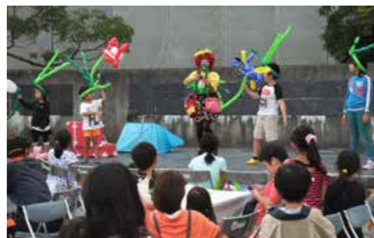
▲大道芸による風船パフォーマンス

地域の和を深める『タベの集い』 【水口地域市民センター】 みなくち自治振興会では、地域の歴史や文化に触れながら、子どもからお年寄りまで世代の交流と絆を深める事業「タベの集い」が、9月24日に開催されました。 地域の方に地元シンボル古城山に親しみと誇りを持っていただくために、「古城山ウォーキング」により水口岡山城の歴史を学びました。会場となった古城が丘公園には模擬店が並び子ども水口囃子の演奏や大道芸によるパフォーマンスなどが行われ、多くの皆さんの参加により、にぎやかな集いとなりました。