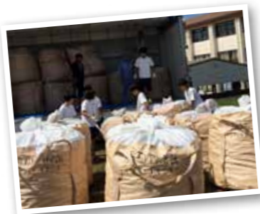
▲集まったアルミ缶をトラックに積み込む生徒

回収をして、積み込みをするのは、とても大変でした。特に、今年は3年生ということで中心となって動かなくてはならなかったのが、大変なことも多かったのですが、仲間と協力して取り組み、無事に終わることができました。昨年よりも多い数のアルミ缶が集まったと知ったときは、暑くても頑張ってたかったと思いました。 この取り組みは、地域の方とのコミュニケーションになるし、ボランティアの大変さや、達成感を学べる、とても良いものだと思うので、これからも続いてほしいです。