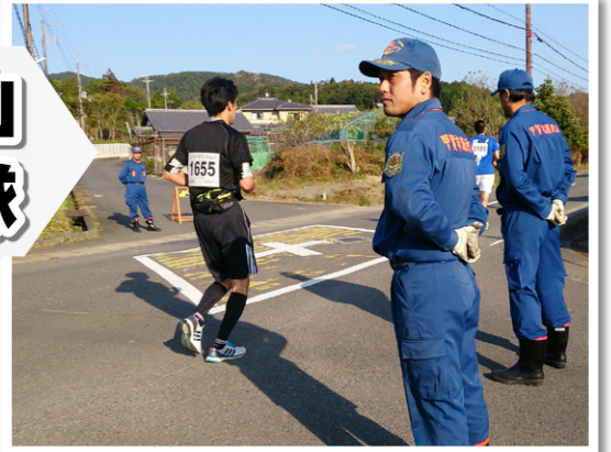
▲沿道でマロンの警護を行う団員