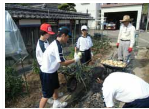
▲野菜の収穫をする生徒たち

事前研修会の開催を予定しています。興味をお持ちの方は、お気軽にお問い合わせください。