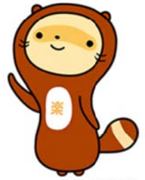
Design: AN GRAPHICS