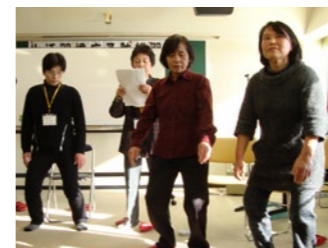
▲講習会でスクワット(下肢筋力をつける運動)をする参加者

運動の目安は、1日合計で20分~60分、週3日~5日くらいを目標に行いましょう。生活の中で、いかに運動の機会を増やすかが大切です。