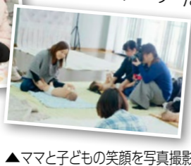
▲ママと子どもの笑顔を写真撮影