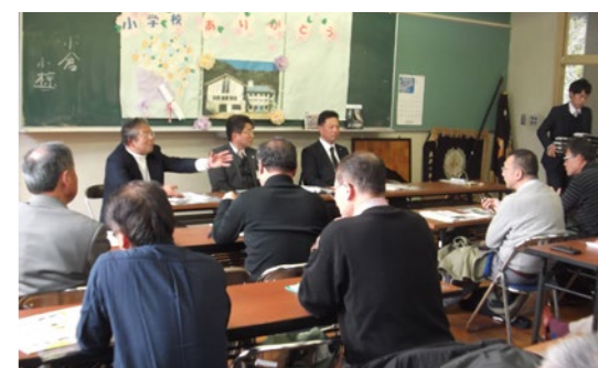
▲東近江市道の駅興永源寺溪流の里での視察

朝宮自治振興会では、小規模多機能自治組織（小規模ながらも、さまざまな機能をもった住民自治のしくみ）の構築にむけて、地域課題検討部会を中心に進められています。買い物支援や地域おこし、高齢者等の見守り活動、行政や小学校への地域の関わり方などこれからのまちづくりには課題がたくさんあります。先日は、先進的に取り組まれている東近江市所地域へ視察訪問しました。今後は、視察で学んだことも踏まえ、朝宮の地域づくり計画が見直しされる予定です。