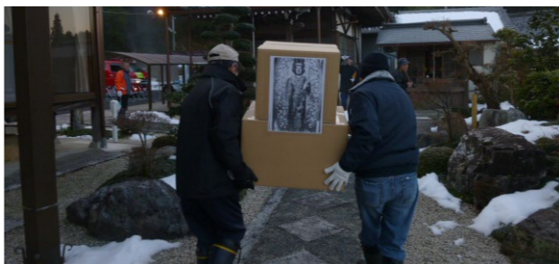
▲段ボール箱を文化財に見立てた搬出訓練

引き継がれてきた地域の宝である文化財を後世に伝えていくことは私たちの重要な責務です。