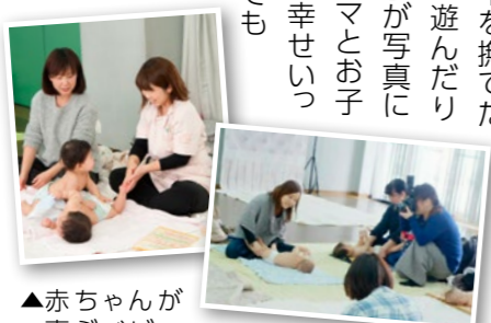
▲赤ちゃんが喜ぶベビーマッサージ

アットホームな雰囲気の中、親子が笑顔で触れ合っているところの写真撮影が行われました。最初はカメラの前で緊張していた子どもも、手遊び歌やママにぎゅっと抱きしめられることで、だんだんと笑顔の表情になりました。お腹や背中を撫でたり、顔を近づけて遊んだり、楽しそうな様子が写真に撮られました。ママとお子さんが見つめ合う幸せいっぱいの子供はとて面白い表情で、参加した皆さんは楽しい思い出の仕上がりを楽しみにしていました。