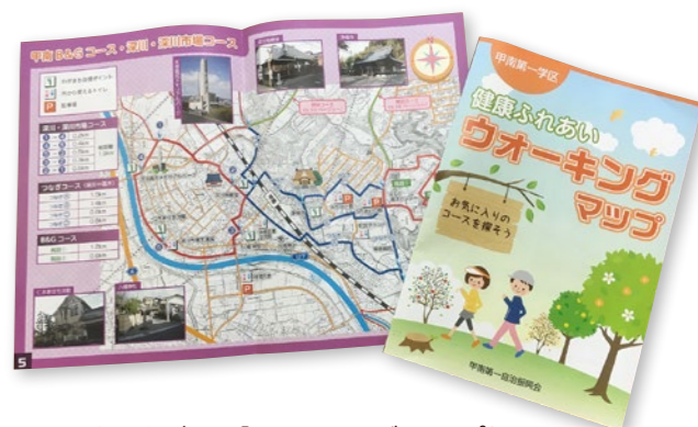
▲出来上がった「ウォーキング・マップ」