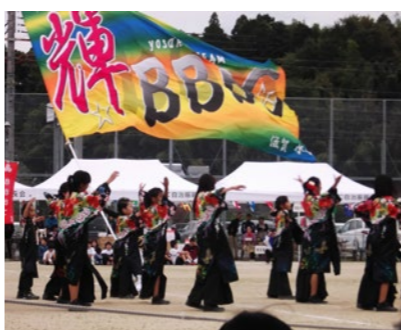
▲よさこいを披露する伴谷BANBANクラブ

伴谷地区にある総合型地域スポーツクラブの伴谷BANBANクラブでは、誰もがいつまでも・健康で・明るく・楽しく生活するためにスポーツや文化活動に老若男女問わず参加されています。大人対象の活動には、健康体操や手芸、フラダンス、ヨガ、山歩き会などがあります。中でも山歩き会では、県内の身近な山に登り、山の楽しさを味わってられます。小学生対象の活動には、陸上、ホリデースクール、よさこいがあります。特に、よさこいは、地域や企業の祭りに呼ばれて発表されるほど、迫力があり見ると元気をもらえます。この活動も活発で、これからの活躍が楽しみです。