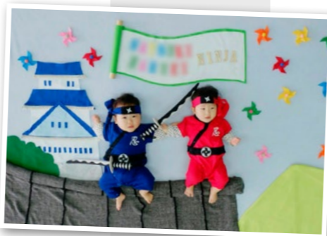
▲忍者姿できめポーズ