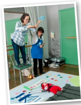
▲おひるねアートの撮影