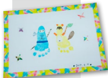
▲忍者とタヌキの足形アート