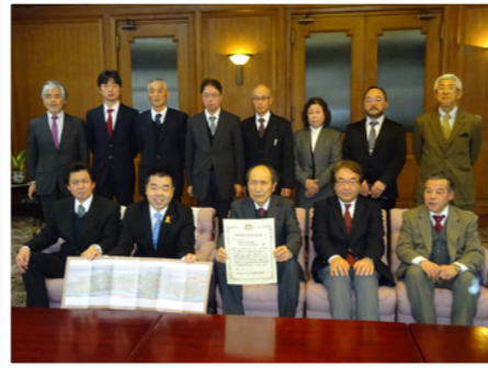
▲県庁での認定書の交付