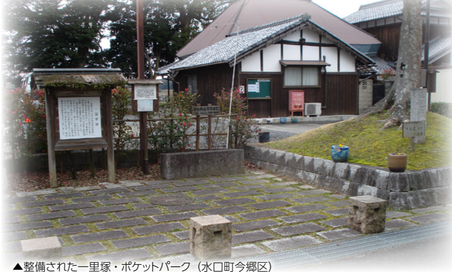
▲整備された一里塚・ポケットパーク（水口町今郷区）

今後こういった活動が他の地区にも広まり、地域が一体となった美しく住みよいまちづくりの取り組みにつながっていくことが期待されます。