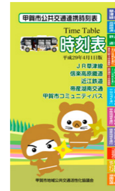
▲時刻表(ポケット版)