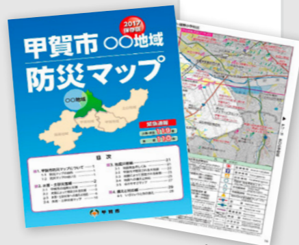
▲新しくなった防災マップ

また、区・自治会に加入されていない方や市内事業所の方は、お近くの地域市民センターまたは、市役所水口庁舎の危機管理課でお渡しします。なお、防災マップは市ホームページでもご覧いただけます。