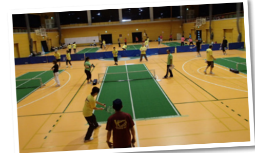
▲バウンドテニスの様子

市内には10カ所の*総合型地域スポーツクラブがあります。多様目・多世代・多志向をモットーに活動している総合型地域スポーツクラブは、地域住民の健康づくりや体力づくりに努めています。スポーツ経験のない方や運動に自信がない方もお気軽にご参加できます。仲間と一緒に、健康な体づくりを始めてみませんか。