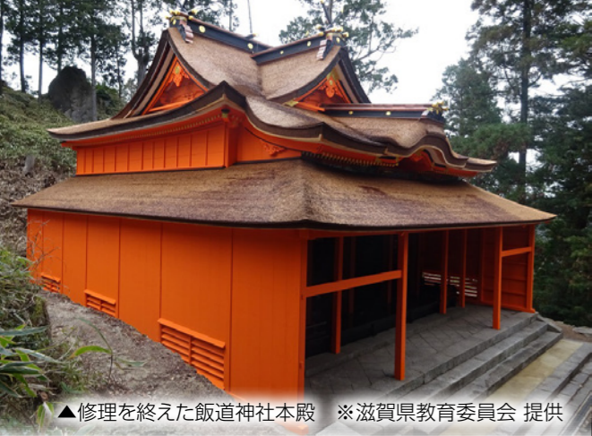
▲修理を終えた飯道神社本殿