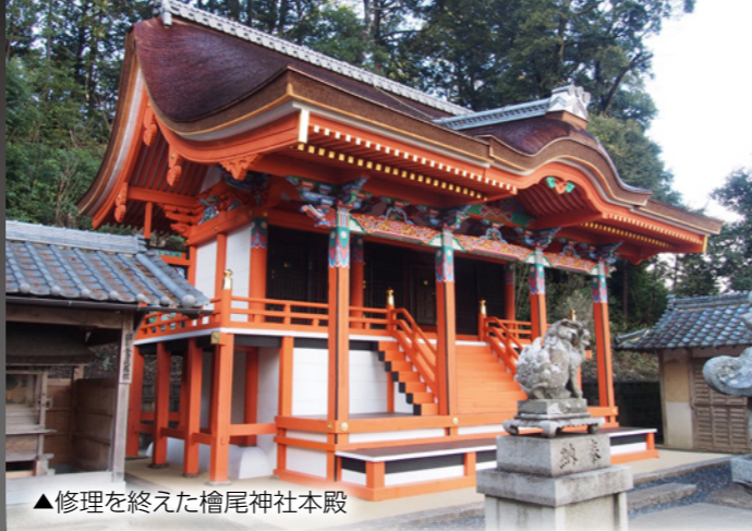
▲修理を終えた檜尾神社本殿