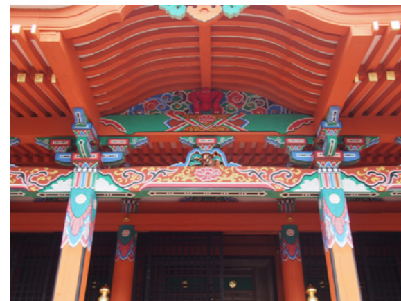
▲よみがえった極彩色 (檜尾神社)

修理工事では、取り外した部材を全て調査し、必要に応じて修理・取り替えた後に再び組み立て、彩色の剥落止めをし、建物全体も塗り直され、創建当初の鮮やかな装飾が復元されました。