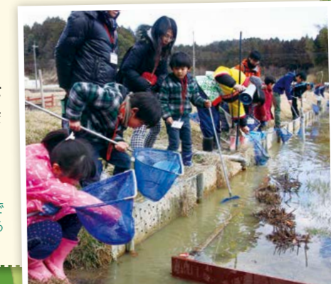
水田内の水路で生き物観察をする参加者

参加者は、「もち米の産地として知っていたが、水田内に水路を設置するなど環境に配慮した農業に取り組んでいることを初めて知った」と訪れてみてわかる地域の魅力を再発見していました。