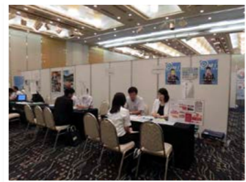
▲昨年度のジヨブフェア

甲賀ジヨブフェア 日時… 7月4日（火）13時～16時 場所… クサツエストピアホテル