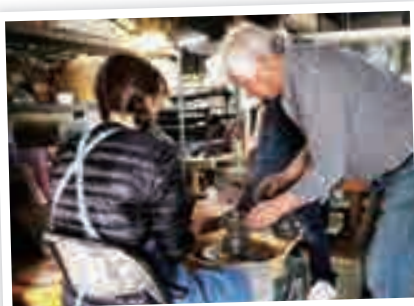
窯元で作陶体験する来場者

長野商店街では、初の試みとして「商店街ぶらり市」が開催され、手打ちそばや朝宮茶など飲食も楽しみながら、一日中のんびりと過ごせる窯元散策路を演出していました。