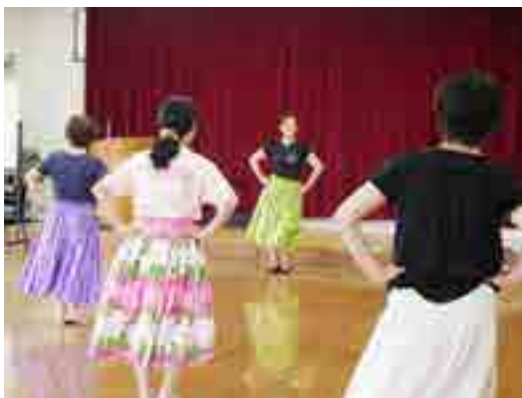
▲ワクワクキウキエアロフラ

昨年から地域の子どもを対象にミニミニ講座の経験者が世話役に回る「子どもミニミニ講座」を始め、かんぴょう作りや防災かまどベンチを使つての自然体験など7講座を実施しました。子どもたち地域への愛着や誇りを少しでも持つてもらえたと思います。