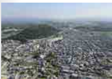
▲水口岡山城跡と水口の町並み