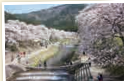
鈴鹿山系の山々とうぐい川の桜並木

会場では、地元産の鮎河菜を使ったおにぎりやパンも販売され、訪れた人は思い思いに咲き誇る桜を満喫していました。