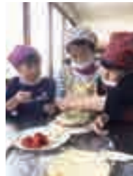
▲ケーキづくりでデコレーションする児童

15年間も活動を継続できた秘訣は？ 活動では、自分の親以外の大人、地域の方と接する機会が多くあります。子どもたちには、地域の大人たちと触れ合い、一緒に学び楽しむことを体験することで、地域とのつながりを広げていってほしいです。また、様々なスポーツなどの活動を通して、自分のやりたい事を見つけてくれればいいと思います。