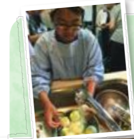
民泊の受入家庭での体験