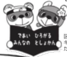
図書館 キャラクター たぬ吉・ポン子