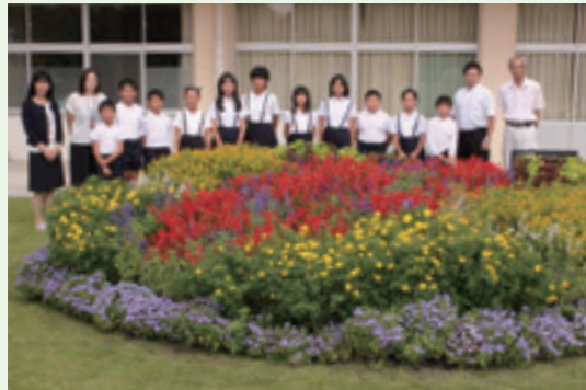
▲秋花壇を囲む佐山小学校の児童たち