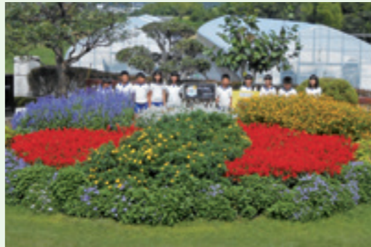
▲秋花壇を囲む甲南中部小学校の児童たち