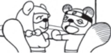
甲賀市の花・木・鳥

もちろん、どの年代の方にもおすすめです。いつもと違う本を読んでもみたい、そんな時にご覧ください。新たな発見があるかもしれません。図書館ではYA世代へおすすめの本を紹介する「YA通信『ホンマニ!』」を夏と冬の年2回発行しています。市内の図書館、中学校・高校の図書室、公民館などに設置していますので、ぜひご覧ください。